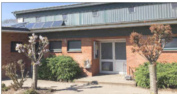
Durch die Schaffung eines barrierefreien Eingangsbereiches können auch die ältere und/ oder gehandicapte Gemeindemitglieder an dem Angebot teilnehmen.

Sobald die Bewilligung des Landesamtes für Landwirtschaft und nachhaltige Landentwicklung vorliegt, können die genannten Maßnahmen mit Unterstützung der AktivRegion umgesetzt werden.