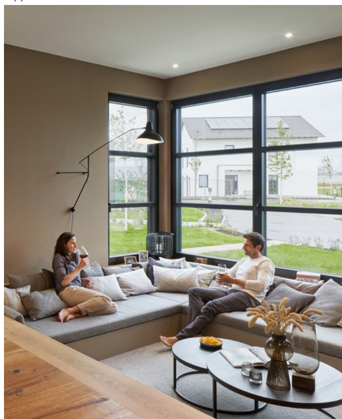
In seinem neuen Haus sollte man sich rundum wohlfühlen können.

(djd). Rund 80 bis 90 Prozent unserer Lebenszeit halten wir uns in Innenräumen auf - einen großen Teil davon in den eigenen vier Wänden. Umso wichtiger ist es daher, dass wir uns im eigenen Heim auch wohlfühlen. Ein gutes Raumklima spielt dabei eine große Rolle. Schadstoffe im Haus, die zum Beispiel in Baumaterialien, Farben und Böden stecken und die wir über die Raumluft einatmen, können vielfältige Beschwerden verursachen - etwa Schwindel, permanente Müdigkeit oder Kopfschmerzen. Wer darüber nachdenkt, neu zu bauen, sollte daher ein besonderes Augenmerk auf hochwertige, geprüft schadstoffarme Materialien und Baustoffe sowie eine fachgerechte, kontrollierte Verarbeitung der Produkte achten. Ebenso wichtig: eine moderne Lüftungsanlage. Infos und Tipps unter: www.weberhaus.de .