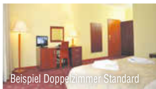
Beispiel Doppelzimmer Standard