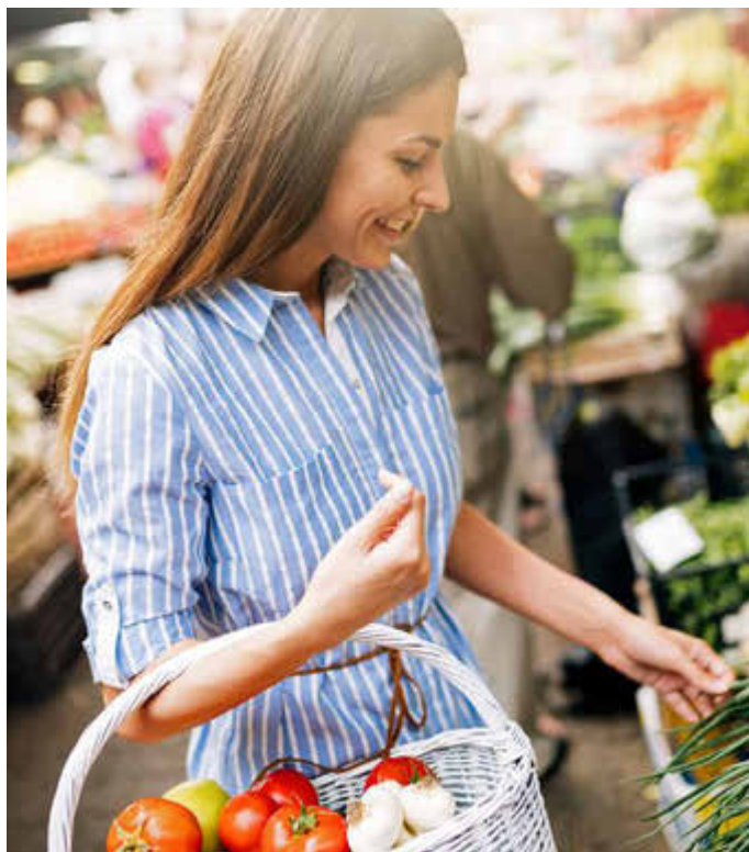
Frisches und saisonales Obst und Gemüse aus der Region ist die Grundlage einer gesunden Ernährung.