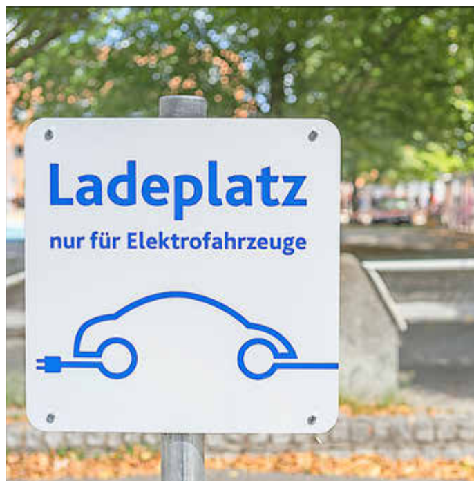
Ein E-Auto soll für die gemeinschaftliche Nutzung in Schuby angeschafft werden.

der ländlichen Entwicklung kennenzulernen und einen Überblick über den Weg von der Idee zum Projekt zu erhalten, bietet die Eider-Treene-Sorge GmbH Ende August die Veranstaltung „Erste Hilfe im Förderdschungel“ an. Weitere Infos sind unter www.eider-treene-sorge.de zu finden.