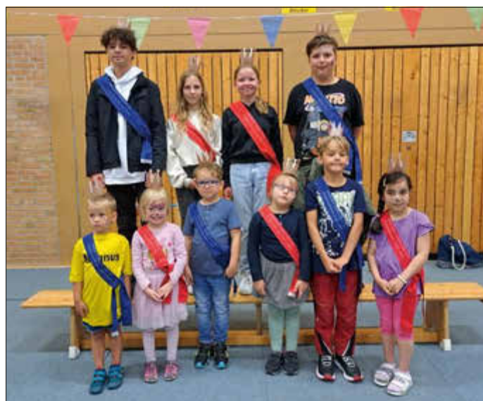
Königspaare Vogelschießen 2023

In Hennstedt startet der Juli mit dem Kindervogelschießen