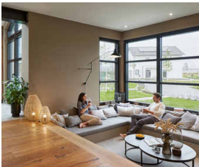
In seinem neuen Haus sollte man sich rundum wohlfühlen können.

Wänden. Umso wichtiger ist es daher, dass wir uns im eigenen Heim auch wohlfühlen. Ein gutes Raumklima spielt dabei eine große Rolle. Schadstoffe im Haus, die zum Beispiel in Baumaterialien, Farben und Böden stecken und die wir über die Raumluft einatmen, können vielfältige Beschwerden verursachen - etwa Schwindel, permanente Müdigkeit oder Kopfschmerzen. Wer darüber nachdenkt, neu zu bauen, sollte daher ein besonderes Augenmerk auf hochwertige, geprüft schadstoffarme Materialien und Baustoffe sowie eine fachgerechte, kontrollierte Verarbeitung der Produkte achten. Ebenso wichtig: eine moderne Lüftungsanlage. Infos und Tipps unter: www.weberhaus.de .