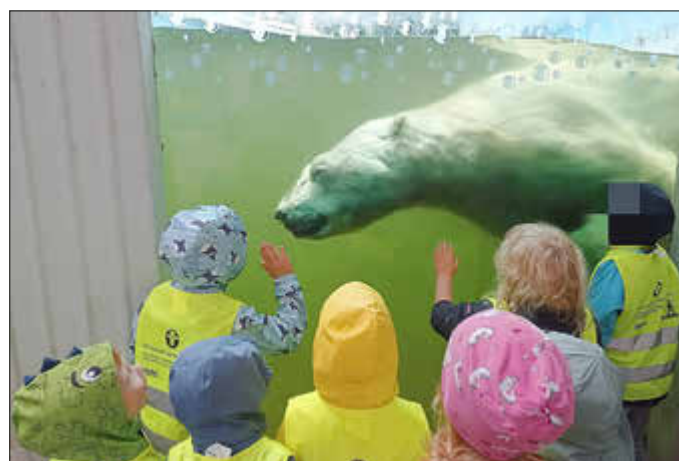
Eisbär ganz nah - Kinder und Betreuerinnen waren fasziniert