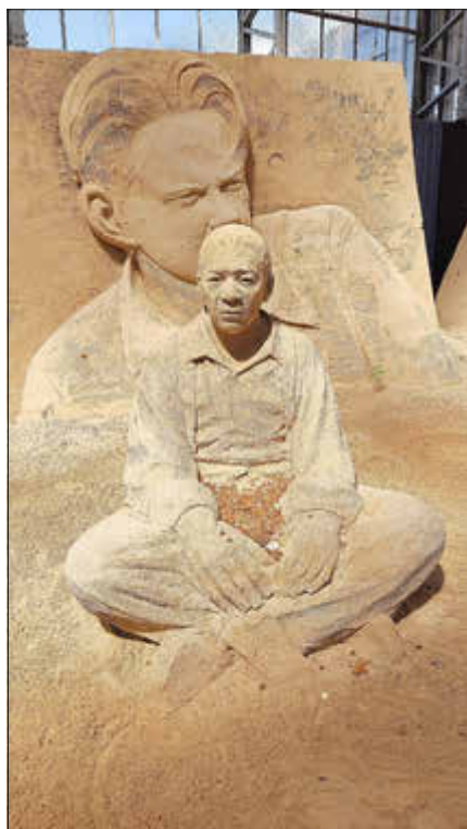
Echt oder doch nur aus Sand?

So schaute der „König der Löwen“ von seinem Felsen majestätisch auf die staunenden Besucher herab. Den älteren Besuchern noch gut bekannt, waren „Dick und Doof“, „die Buddenbrooks“ und der „blaue Engel“ meisterhaft in den Sand modelliert. Aber auch Filme, wie „Avatar“ oder