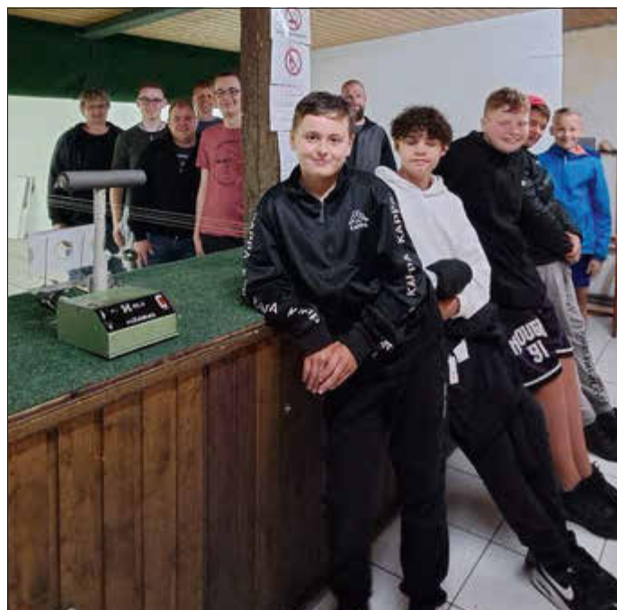
Teil der „Luftgewehrschießer“, Leitung Kyffhäuser Veteranen Kameradschaft

Hennstedter Dorf-Flohmarkt 10 - 16 Uhr Sonntag 03.09.2023