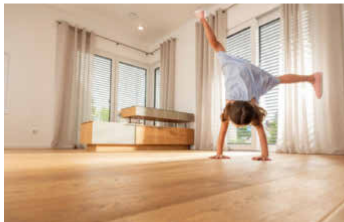
Parkett bringt eine behagliche Atmosphäre in jeden Raum. Der Dauerbrenner für den Boden ist zudem ein besonders nachhaltiges Material.

(djd). Echtes Parkett ist eine Entscheidung fürs Leben. Der Bodenbelag hält über Generationen und lässt sich bei Bedarf immer wieder aufbereiten. Gleichzeitig fördert ein Boden aus Holz ein gesundes Raumklima und zählt daher seit jeher zu den besonders nachhaltigen Baumaterialien. Mit dem Einsatz von lösemittelfreien Profiprodukten für die Parkettverlegung oder Oberflächenversiegelung profitieren die Bewohner ebenso von einer umweltschonenden Verarbeitung. Dazu bietet beispielsweise der Parkettspezialist Pallmann mit dem "Pall-X Zero System" nachhaltige Produkte an. Die Verarbeitung sollte stets durch erfahrene und entsprechend qualifizierte Fachleute erfolgen, unter www.parkettprofi.de lassen sich Betriebe in der eigenen Region finden.