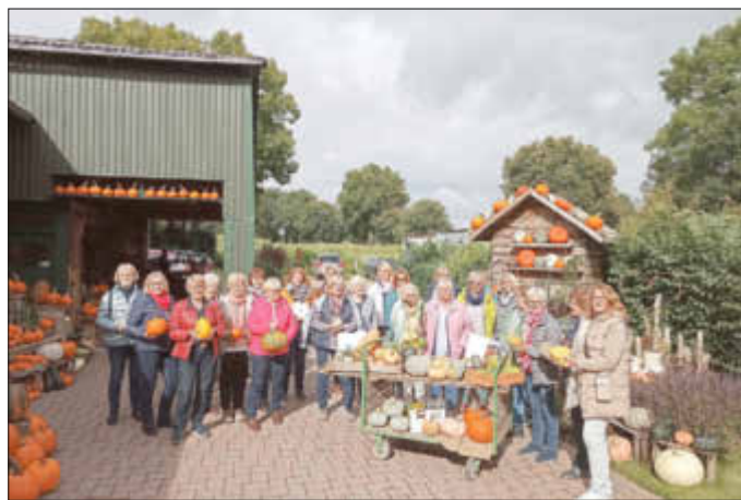
Tellingstedter Landfrauen besuchen den Kürbischhof Kruse in Buchholz