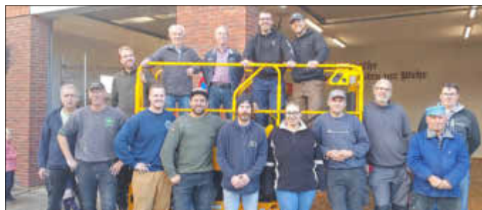
Das fleißige Team! Nicht alle Helfer sind abgebildet.