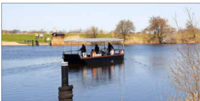
Die Bargener Fähre hat sich die Errichtung einer PV-Anlage zur Stromversorgung über das Regionalbudget fördern lassen

Interessierte können sich direkt beim Regionalmanagement, Tel. 04333 9924914, E-Mail: l.brauer@eider-treene-sorge.de über das Regionalbudget und die Rahmenbedingungen informieren. Die Antragsunterlagen sind zudem auf www.aktivregion-ets.de abrufbar.