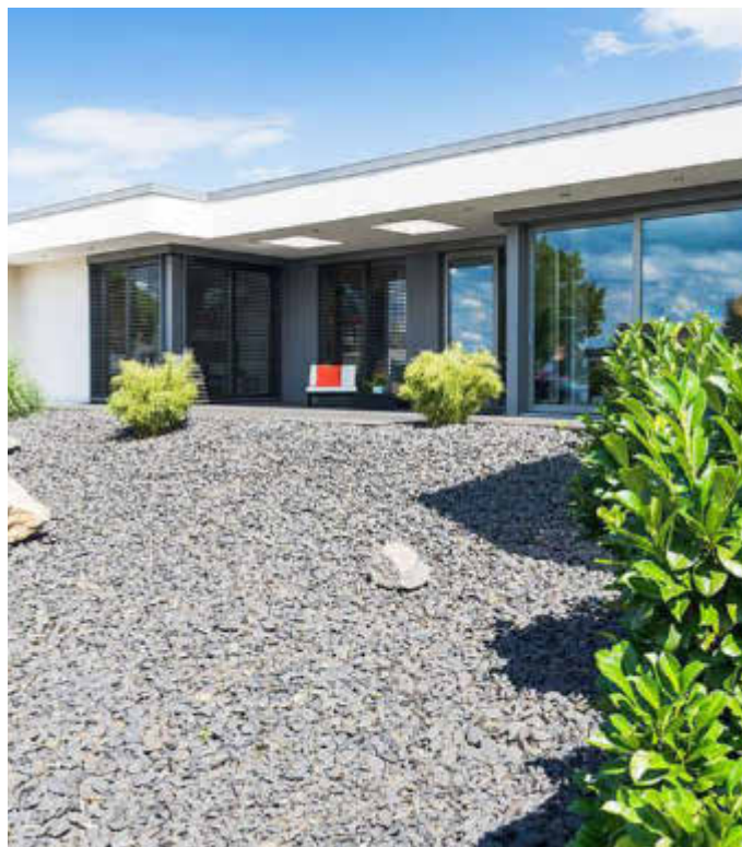
Das Wohnen auf einer Ebene ohne Treppenstufen überzeugt viele vom Bau eines Bungalows. Bei Flachdächern kommt es auf eine langlebige und effektive Wärmedämmung sowie Abdichtung an.

Flachdächer bieten zudem den Vorteil einer zusätzlichen Nutzung. In begrüntem Zustand verbessern sie das Mikroklima insbesondere in urbanen Bereichen. Darüber hinaus entsteht neuer Lebensraum für Insekten und Vögel. Für die Realisierung eines Gründachs ist das Dämmsystem aufgrund seiner hohen Stabilität bestens geeignet. Der Dachaufbau ist begehbar und lässt sich durch Fachbetriebe als Garten auf dem Dach anlegen, ob in extensiver, pflegeleichter Variante, als Dachbiotop oder intensiv begrünt. Unter www.ratgeberrdach.de gibt es mehr Details zu den verschiedenen Versionen, ein Dachlexikon mit wichtigen Fachbegriffen sowie Informationen zu Fördermitteln und Zuschüssen.