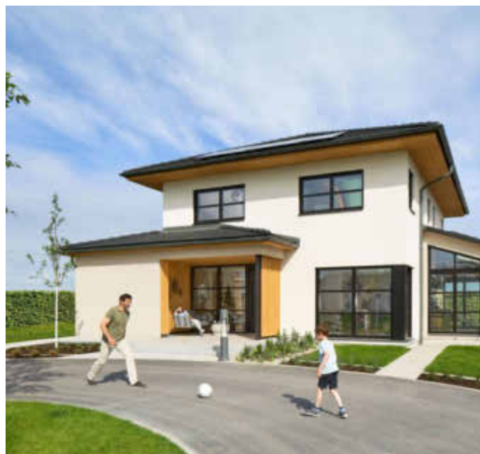
Das neue Ausstellungshaus in Kappel-Grafenhausen zeigt, wie sich Familien einen modernen Wohnraum erfüllen können.

(djd). Sich im eigenen Zuhause rundum wohlfühlen zu können, dürfte einer der größten Wünsche zukünftiger Eigenheimbesitzer sein. Das gelingt, wenn das Haus voll und ganz auf die persönlichen Vorstellungen und Ansprüche seiner Bewohner abgestimmt wird. Moderne Fertighäuser werden diesen Bedürfnissen gerecht. Denn sie sind keine Häuser von der Stange, sondern immer Unikate. Ein besonders kleines oder schwierig zu bebauendes Grundstück? Ein außergewöhnlicher Grundriss oder Architekturstil? Begehrtes Ankleidezimmer, Treppenlift, Dachterrasse oder Sauna? Individuelle Wünsche können in jedem freigeplanten Architektenhaus erfüllt werden. Doch auch Häuser aus Baureihen können auf die persönlichen Vorstellungen seiner künftigen Bewohner hin zugeschnitten werden. Infos: www.weberhaus.de .