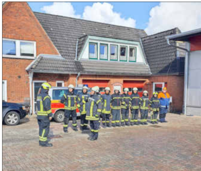
Antreten zum Formaldienst mit Meldung an den Wehrführer