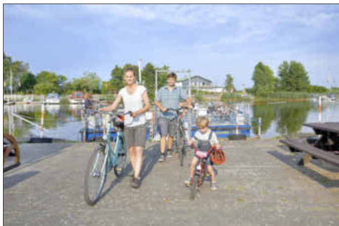
Die beliebten Kleeblatt-Radtouren entlang der Hohner und Bargener Fähre sollen optimiert werden.