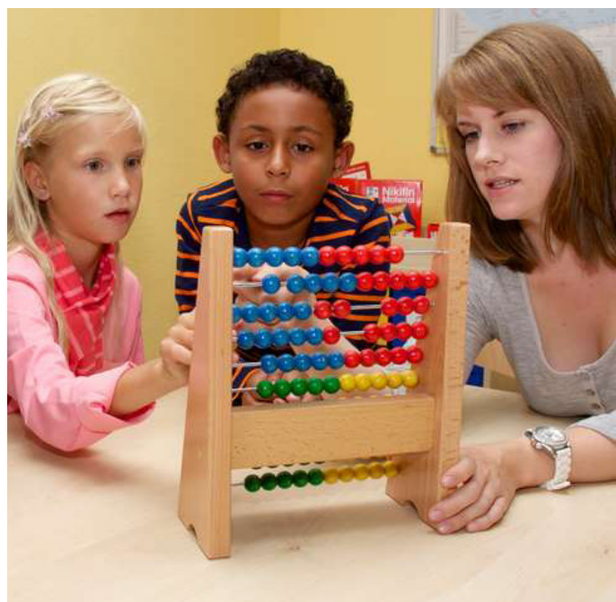
Als Nachhilfekraft kann man Schülern helfen, ihre Corona-bedingten Lernrückstände aufzuholen.

(djd). Angehende Lehrerinnen und Lehrer können schon während ihres Studiums Arbeitserfahrung als Dozenten in der Nachhilfe sammeln. Seriöse Arbeitgeber geben ihren Mitarbeitern und Mitarbeiterinnen erprobte Leitlinien an die Hand, die sowohl der Lehrkraft als auch dem Schüler als Hilfestellung dienen. Der Studienkreis bietet darüber hinaus eine spezielle Zertifizierung zur „geprüften Lehrkraft für individuellen Förderunterricht“ an. Und da sich die Digitalisierung immer weiter auf dem Vormarsch befindet, können sich angehende Nachhilfelehrkräfte unter www.studienkreis.de über eine separate Qualifizierung zum „eTutor für Online-Nachhilfe“ informieren. Ein TÜV-Siegel ist ein weiterer Indikator für ein qualitativ hochwertiges Nachhilfeeinstitut, das seine Mitarbeiter ordentlich ausbildet.