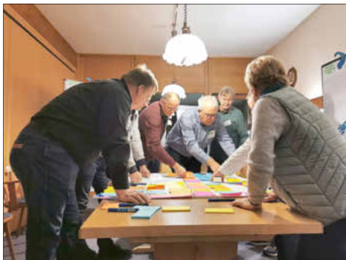
In Kleingruppen wurde eine Vision 2030 erarbeitet.