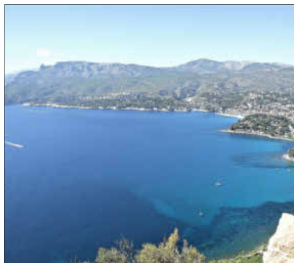
Die Bucht von Cassis

Beginn ist um 19:30 Uhr im Feuerwehrgerätehaus. Der Eintritt ist frei. Es wird um eine Spende zugunsten der Freiwilligen Feuerwehr Rederstall gebeten. Einlass nur unter Einhaltung der 2G-Regel für Geimpfte und Genesene mit Impfpass oder CovPass bzw. entsprechender App und Lichtbildausweis.