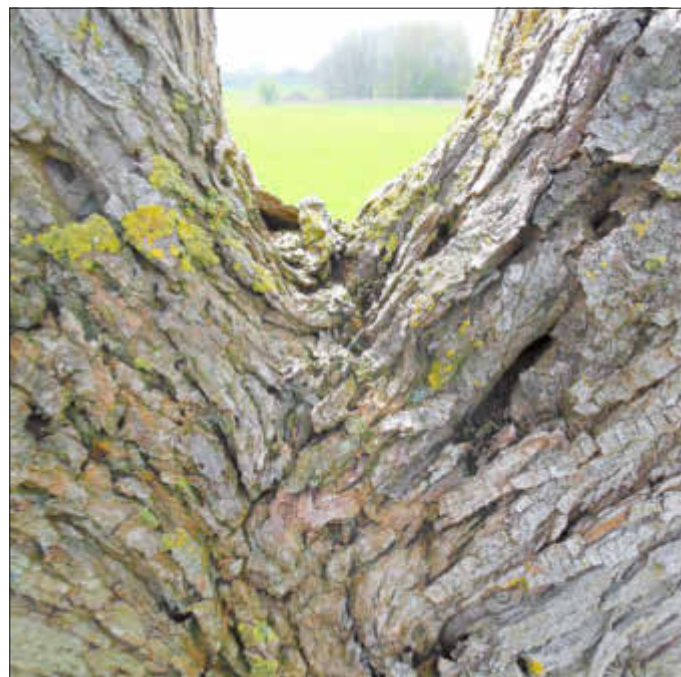
„Baum“: ein Foto aus der Diaserie des Konzertes am 21.8.2021

Am Samstag 21.8.2021 findet in der Kulturetage im Haus des Gastes in Krempel wie im vergangenen Jahr eine Veranstaltung im Rahmen des Kunstgriff Dithmarschen statt. Um 18:00 Uhr beginnt ein Konzert, bei dem Musik, Diaserien, Wortbeiträge und Tanz sich abwechseln unter dem Motto „Alles ist Bewegung“. Das Programm ist in drei ca. 45 minütige Abschnitte mit Pausen aufgeteilt. Live-Musik spielt „and friends“ auf Gitarren, Bass, Ukulele, Mundharmonika und Percussion, mit mehrstimmigem Gesang. Blues, Folk, Rock, Pop und mehr auf Englisch, Deutsch und Plattdeutsch.