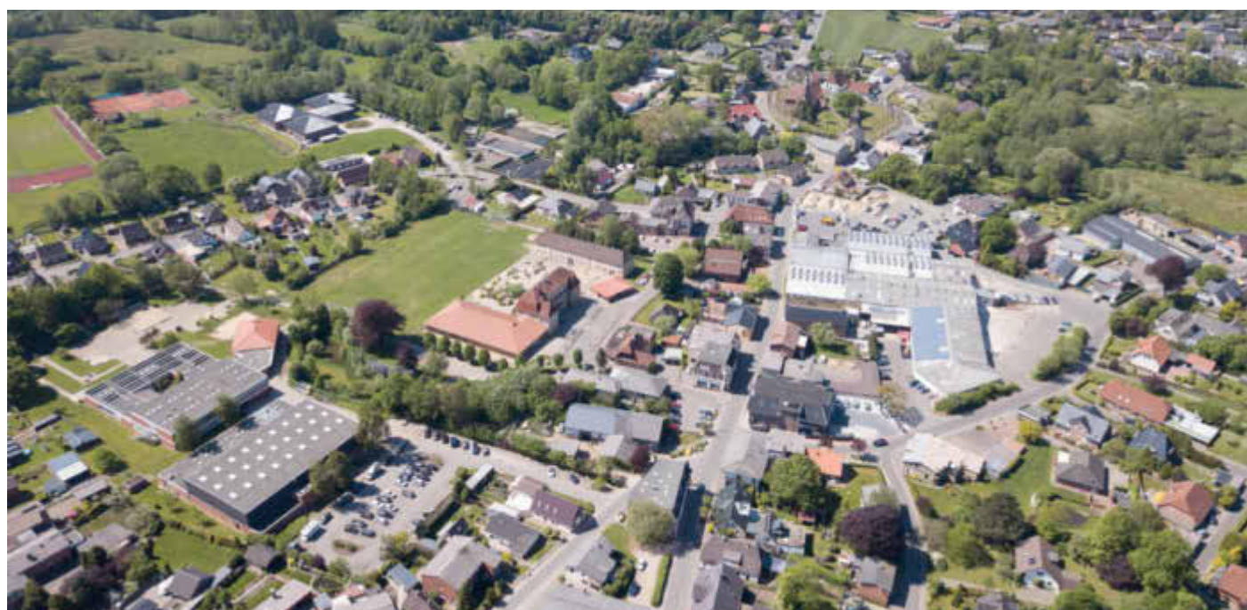
Luftaufnahme von Tellingstedt