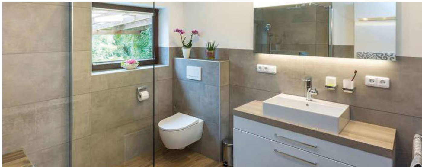
Das Ergebnis kann sich sehen lassen: Auch ältere Bäder können sich in behagliche Wellnessoasen verwandeln.

an der charakteristischen grünen Färbung zu erkennen. Zuerst wird auf die Gipsplatten die Grundverspachtelung aufgetragen und glatt abgezogen. Nach dem Trocknen die überstehenden Grate abstoßen. Anschließend folgt das gebrauchsfertige Uniflott Finish ebenfalls in der imprägnierten Variante zur Endverspachtelung. Unter www.knauf.de/diy erhalten Selbsterbauer weitere Tipps.