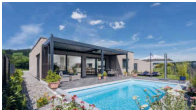
Bauen mit Holz ist nachhaltig und geht auch individuell.

(djd). Immer mehr Bauherren richten den Fokus auf die Energieeffizienz und Umweltfreundlichkeit ihres Neubaus - und entscheiden sich für ein Fertighaus aus Holz. Der nachwachsende Rohstoff bindet CO2 und gibt Sauerstoff ab, wodurch das Bauen mit Holz einen aktiven Beitrag zum Klimaschutz leistet. Beim Fertighaushersteller WeberHaus etwa sorgt eine ökologische Gebäudehülle aus Holz für einen hervorragenden Wärme-, Kälte- und Schallschutz und legt damit die Basis für einen niedrigen Energieverbrauch. Daneben punkten die Häuser des badischen Herstellers mit energiesparender Haus- und Heiztechnik. Sie sind standardmäßig mit einer Photovoltaikanlage mit Speichersystem sowie mit Frischluft-Wärmetechnik und einer smarten Haussteuerung ausgestattet. Infos gibt es unter www.weberhaus.de .