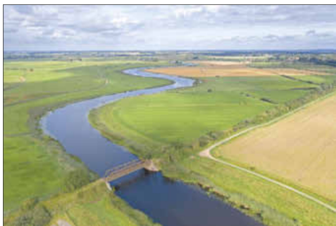
Malerisch schlängelt sich die Treene durch die Region – Schwabstedt mit alter Eisenbahnbrücke

Der neue Fotokalender „Zwischen Eider, Treene und Sorge 2022“ ist zum Preis von 19,50 € bei EDEKA Lacina in Erfde oder direkt bei Uwe Naeve (Tel.: 0170-28 25 689, info@un-naturfoto.de) erhältlich. Auf www.un-naturfoto.de können die einzelnen Monatsblätter angeschaut werden.