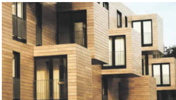
Das Naturmaterial Holz bietet alle Voraussetzungen für Gebäude mit besonderem Charakter.