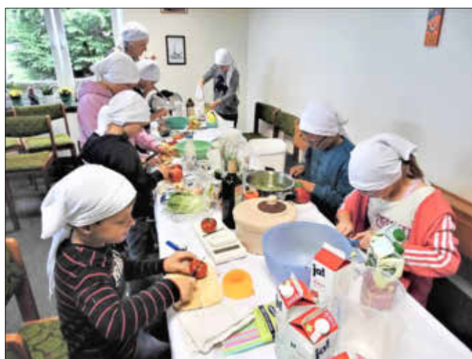
Mit Eifer dabei

Gemüsesuppe mit Grünkern (vegetarisch) die in 15 Minuten schonend in einem Dampfkochtop gekocht wurde, einen Griechischen Salat (wahlweise mit Schafskäse oder Salatkernen), Obstsalat mit Ananasjoghurt verfeinert, leckere Quarkwaffen in Herzchen Form, bunte Käsespieße, die von den jüngsten Teilnehmern zubereitet wurden und eine köstliche Bananenmilch, die wahlweise mit Kirschsafte als KIBA aufgegossen wurde. Hier konnte eine Jungs Gruppe gleich mit einem Hightech Gerät das pürieren der Bananen ausprobieren. Die erste Gruppe die mit ihren Zubereitungen und reinigen fertig war, zauberte noch für alle Teilnehmer hübsche Servierten für die Tische. Dann setzen sich alle kleinen Köche und die JRK Helfer Damen gemeinsam an die Tische. Da man sich in einem Kirchenraum befand wurde noch ein kleines Tischgebet gesprochen: „Jedes Tierlein hat sein Fressen, ...“. Weil alle Kinder so lecker gekocht hatten, da waren sich die DRK Damen einig, sollte jeder eine Urkunde bekommen. Nachdem am Ende alles aufgeräumt, abgewaschen und abgetrocknet war, konnten die JRK Kinder sogar auch noch jeweils zu zweit eine entspannende Pizzamassage durchführen. Zum Abschied wurde noch das JRK Lied gesungen und alle Kinderköche gingen fröhlich und gut gestärkt nach Hause.