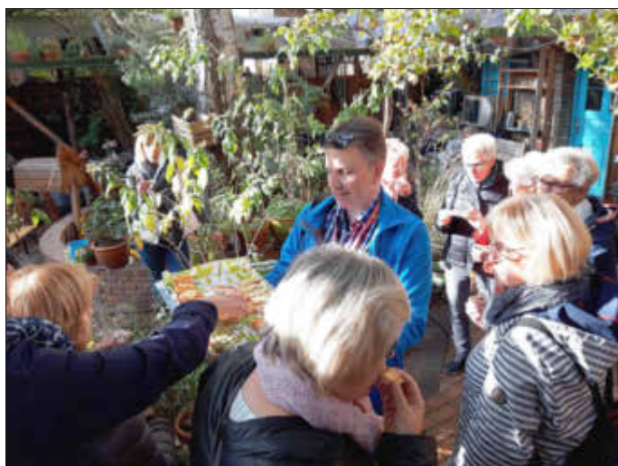
Tellingstedter LandFrauen bei einer Kostprobe

Dann ging es zum alten Lessingbad, hier befindet sich jetzt das „Café Freistil“, eine Kindertagesstätte und die Turnhalle des Humboldt Gymnasiums. Das Restaurant bietet Arbeitsplätze für Menschen mit und ohne Behinderung und hat eine reichhaltige saisonale und regionale Küche.