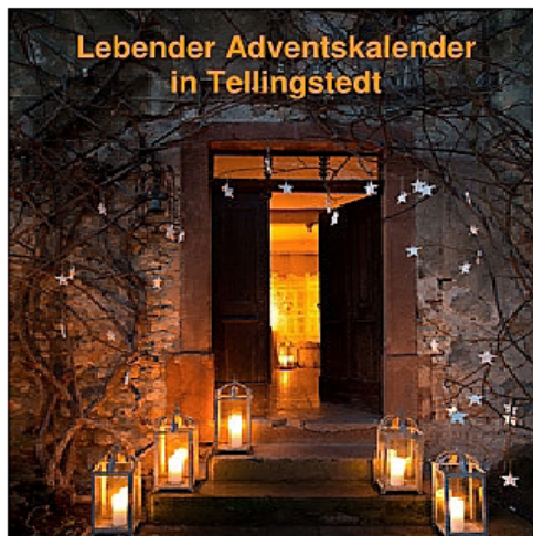
Lebender Adventskalender in Tellingstedt

A n jedem Abend zwischen dem 1. Advent, das ist der 01. Dezember und dem 23. Dezember , öffnet sich um 18.00 Uhr irgendwo in der Kirchengemeinde ein Fenster.