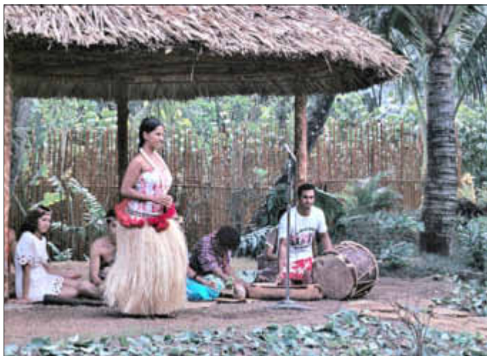
Hula-Tanz im Polynesian Cultural Center

Gäste sind herzlich willkommen. Der Eintritt ist frei. Es wird um eine Spende zugunsten der Feuerwehr Rederstell gebeten.