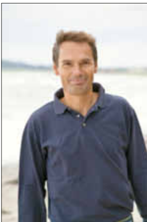
Prominenter Gast: Meeno Schrader ist in diesem Jahr Schirmherr.

Austoben können sich die Kleinsten dann auf der Hüpfburg oder beim Spielmobil der Jugendfeuerwehr, die den Bauernmarkt wieder kräftig unterstützt. Oder es geht mit Mama und Papa zum Kinderflohmarkt in der Treenestraße - dort dürfen alle Kinder bis 12 Jahre kostenfrei mit dem Verkauf alter Spielsachen ihr Portmonnaie aufbessern. Wenn sie das verdiente Geld nicht gleich bei der großen Tombola investieren: Beim Gewinnspiel der Veranstalter vom HGV Schwabstedt und Umgebung kann es mit Leichtigkeit vervielfacht werden. Unter den mehr als 60 Preisen sind auch ein dreitägiger Aufenthalt im Strandhotel St. Peter-Ording, eine Tour zur Grünen Woche und eine hochwertige Dekogartensäule.