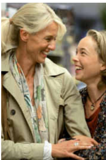
Der Freundschaftsdienst zur Woche des Hörens: Ein Hörtest beim FGH Hörakustiker.

Dazu zählen nicht nur die Schwierigkeiten beim Sprachverstehen, sondern auch Begleitscheinungen wie Überanstrengung, Konzentrationsprobleme und vielfältiger Stress. Insgesamt leiden dauerhaft das Wohlbefinden und die Lebensqualität. Diese Zusammenhänge sind vielen