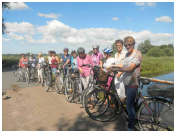
In Damnbrück an der Broklandsau

Bei perfektem Sommerwetter machte sich eine Gruppe Radfahrerinnen in Richtung Hennstedt auf, ihre nächste Umgebung zu erkunden. Über den Gerichtsweg in Rehm ging es nach Fedderingen. An der Brücke über die Broklandsau, einem idyllischen Ort, wurde die erste Trinkpause eingelegt.