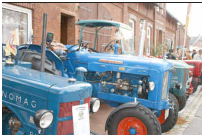
Die Oldtimer-Trecker sind ein Hingucker.

„Na klor, un wie. Dat kann ik di seggn, Herr Afftheeker, vun nu an truu ik mi al gorni mehr to hossen!“