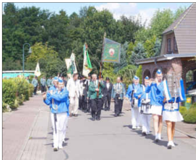
Schützenumzug durch Krempel.

Die Tombola war reichlich bestückt mit wertvollen Sachspenden aus der Geschäftswelt. Noch bis in die frühen Morgenstunden feierte die Gesellschaft ihre neuen Preisträger. Mit Tanz, Geselligkeit und Spaß ist der Ball ein krönender Abschluss der Schützenwochen.