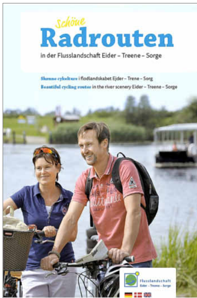
Die Bargener Fähre zielt das neue Ringbuch für Radfahrer.