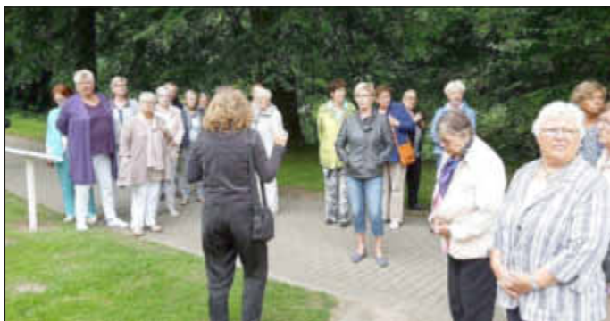
Lunderer LandFrauen lauschen den Erklärungen der Führerin.

Heute findet man neben den Gräbern vieler Hamburger Berühmtheiten auch Begräbnisstätten für alle Religionen, Themengrabstätten wie Baumgräber, Ruhewald, Rosengrabstätte, Paaranlagen und vieles mehr.