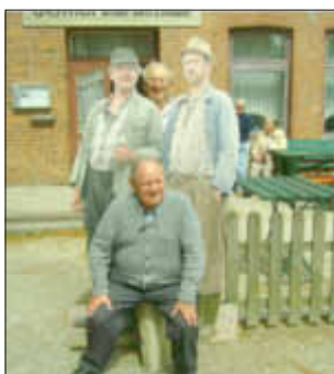
Gemeinsames Foto mit Brakelmann und Adsche

Gut gestärkt ging es weiter nach „Büttenerwärd“ auf einen „Lütt und Lütt“ in Shortys Kneipe, dem Drehort der NDR-Kult-Serie „Neues aus Büttenerwärd“. Der Dorfkrug heißt eigentlich „Gasthof unter den Linden“ und steht im Ort Grönwöhd, nördlich von Trittau. Drinnen sieht es genauso aus, als wären Adsche und Brakelmann gerade aufgestanden und mit ihrem Mofa und dem alten Fendt-Traktor vom Hof geritten. Danach ging es weiter zum nächsten Drehort, dem Hof von Kurt Brakelmann mit dem original „Misthaufen“ in Granderheide.