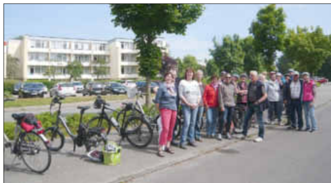
Die Lunderer Radlergruppe vor dem Start in Weißenhäuser Strand

Am 15. Juni morgens verlud ein Busunternehmer aus Flensburg am Gänsemarkt in Lunden 25 Fahrräder in seinen Anhänger. Die dazugehörigen LandFrauen und Gäste stiegen mit einem skeptischen Blick zum mit Regenwolken verhangenen Himmel in den Bus. In Weißenhäuserstrand verließen sie das Fahrzeug mit einem breiten Lächeln. Die Sonne strahlte zwischen ein paar freundlichen Wolken hervor.