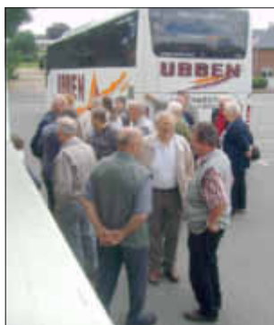
Warten auf die Weiterfahrt

Hollingstedt/Bergewörden: Jedes Jahr organisieren die Gemeinden Hollingstedt und Bergewörden für ältere Mitbürgerinnen und Mitbürger einen interessanten und geselligen Tagesausflug. In diesem Jahr führte die Fahrt nach Nevesdorf, Büttenerwärd (Grönwöhd) und Gut Basthorst im Kreis Stormarn