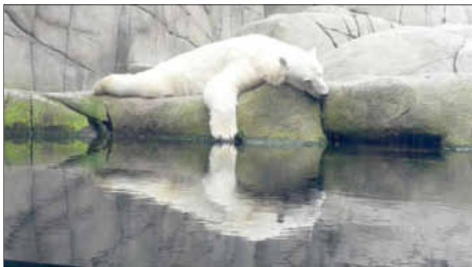
Auch ein Eisbär braucht seine Mittagsruhe.

Der zweite Teil des Tages führte die Landfrauen, gestärkt nach einem leckeren Mittagessen, in den Tierpark Hagenbeck. Hier konnte jede auf eigene Faust auf Entdeckungsreise gehen und ihre Lieblingstiere aus aller Welt sehen. Besonders begeistert waren die Teilnehmerinnen von den arktischen Bewohnern der imposanten, auf mehreren Ebenen angelegten Eiswelt und den Schauaufführungen.