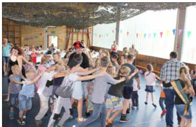
Der Förderverein bedankt sich bei allen Spendern, Helfern und der Gemeinde Schalkholz für die Unterstützung, damit das Vogelschießen auch zukünftig stattfinden kann und weiterhin bei den Kindern viel Freude bereitet.