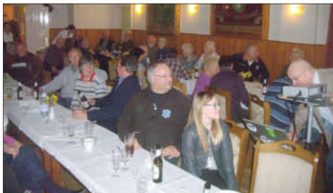
Zahlreiche Gäste in Struves Gasthof.