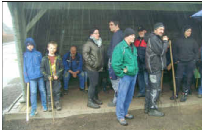
Die Sammler treffen sich bei Regen an der Bushaltestelle.