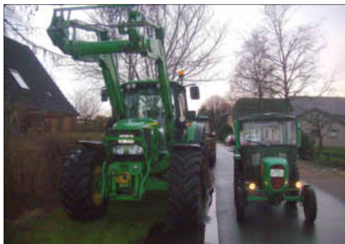
60 Jahre Unterschied: alte und junge Trecker nach im Arbeitseinsatz