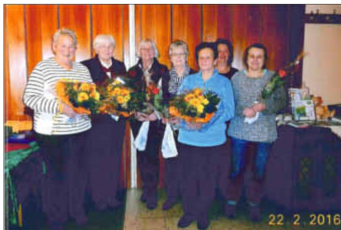
Auf dem Foto von links:

Jeden Montag um 20:00 Uhr treffen sich die Sangeschwestern im Vereinslokal „Struve's Gasthof“ in Delve. Wer Freude am Gesang hat, kann gerne an einem Übungsabend herzlich gerne vorbei kommen.