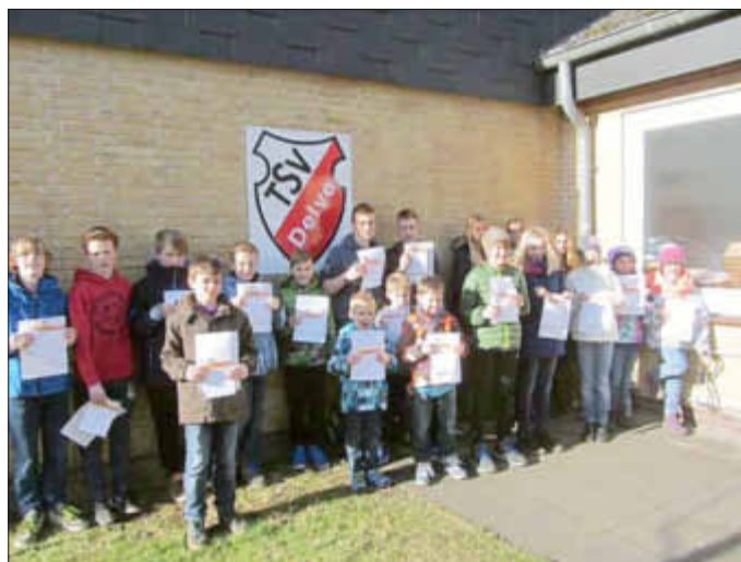
Ziel erreicht - die tüchtigen Sportlerinnen und Sportler

Infos über die Bedingungen zum Erreichen des Deutschen Sportabzeichens: www.deutsches-sportabzeichen.de