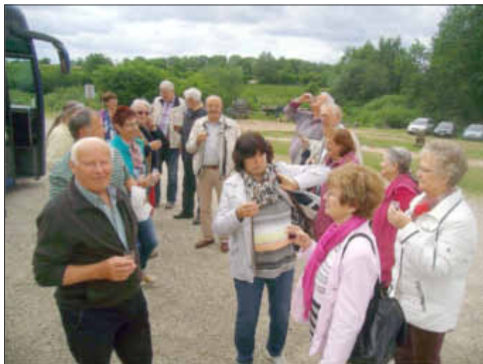
Ein Verdauungsschnaps nach dem Spargelbuffet