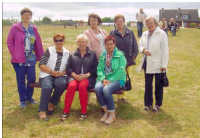
Zufrieden nach dem Essen

Delve/Hollingstedt: Mitglieder aus beiden Ortsverbänden fuhren an den Ratzeburger See zum Spargelessen.