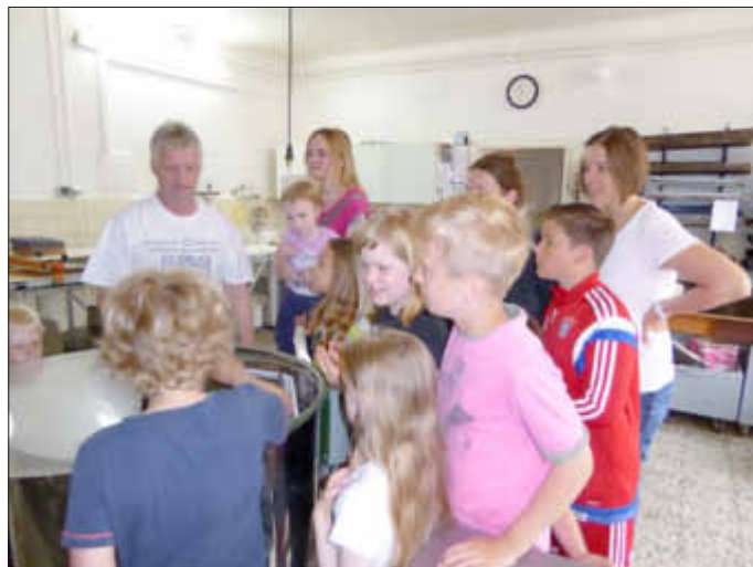
Gemeinsam an der Honigschleuder