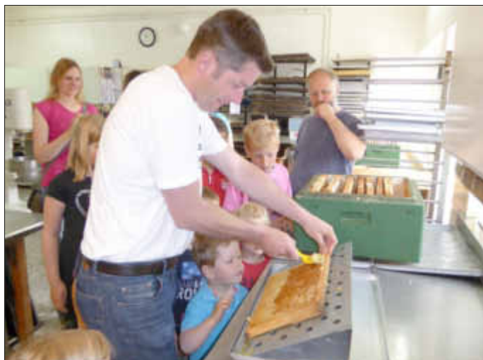
Arbeiten an der Honigwabe