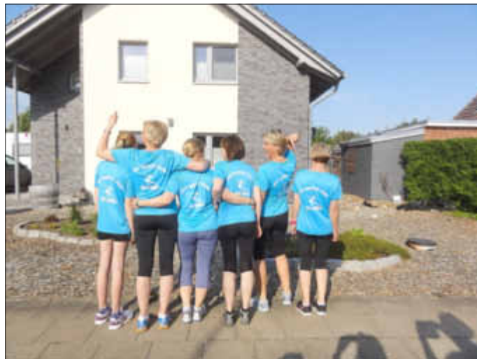
Die SSV-Lunden „Fit with Fun-Gruppe“ glücklich nach dem Lauf.