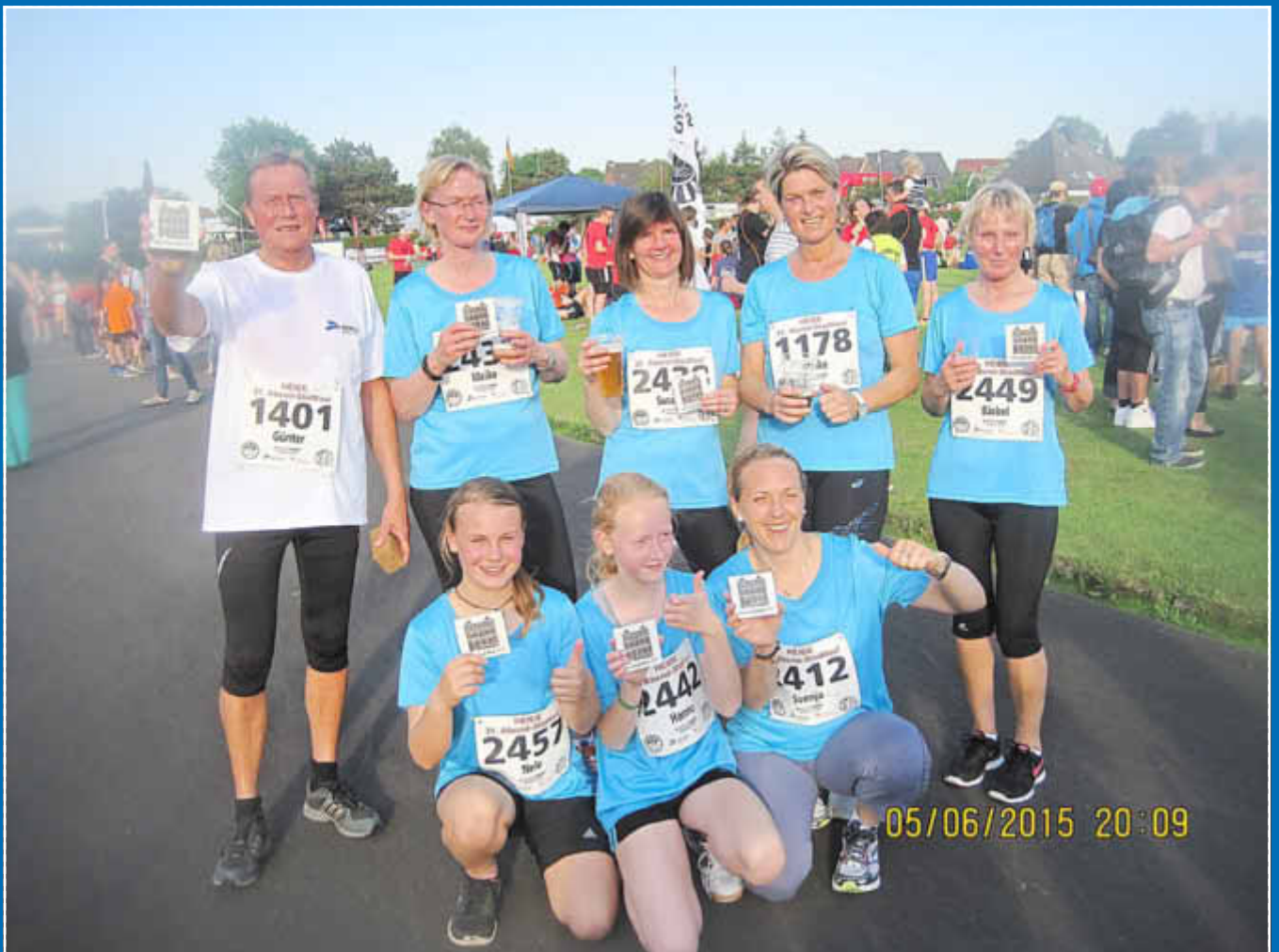
Fit with Fun-Gruppe des SSV Lunden erfolgreich beim Heider Abend-Stadtlauf