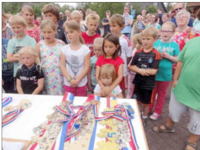
Ungeduldiges Warten auf die Proklamation.