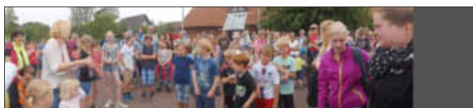
Ein Panorama von der Krempler Vogelschießer-Gemeinschaft.