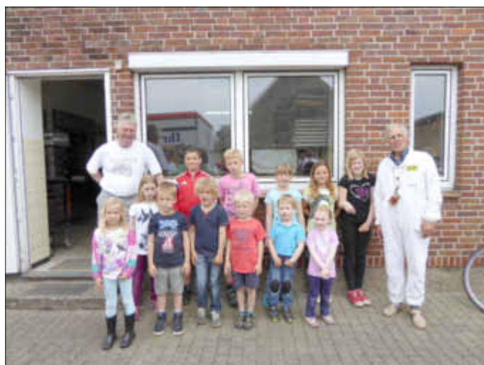
Imker und Honigkinder