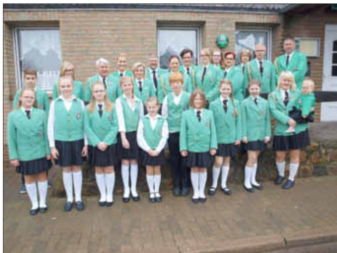
Die Spielleute vor dem Konzert

Unter der musikalischen Leitung von Ulrike Wölbing und Dirigent Björn Bergeest zeigten die 30 jungen Spielleute, zu welchen musikalischen Leistungen ein modernes Spielleuteorchester mit erweitertem Instrumentarium in der Lage ist. Sie erfreuten das Publikum mit einem bunten musikalischen Blumenstrauß, bestehend aus traditionsreichen deutschen, amerikanischen und holländischen Märschen und modernen Kompositionen der Spielmanns- und Filmmusik, Tangoklänge und internationalen Evergreens, fröhlichen und besinnlichen Melodien, der einen kleinen Querschnitt aus der breiten Palette ihrer musikalischen Ausbildung widerspiegelte; darunter Märsche, wie z. B. Gruß an Kiel, Scotland the Brave und ein Medley bekannter Sousa-Melodien, Filmmusiken wie „The Final Countdown“ und „The Eye of the Tiger“ und rockige Stücke wie „Golden Sun“ und „Wipe out“.