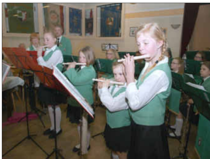
Der Nachwuchs spielt auf.