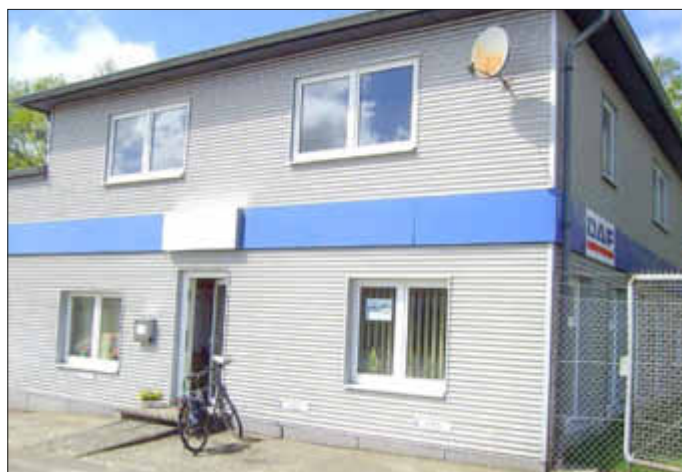
VHS in der Albersdorfer Str. 14