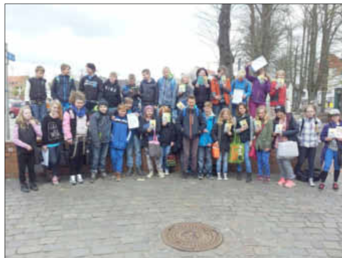
5a und 5b in Aktion zum Welttag des Buches