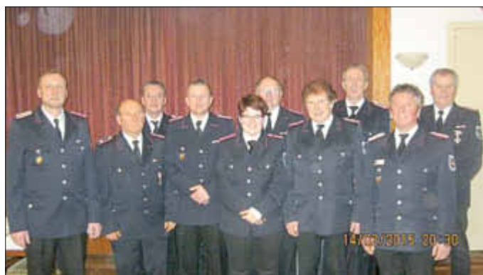
Die geehrten und beförderten Kameraden mit Kreisbrandmeister, Wehrführer und stellv. Wehrführer