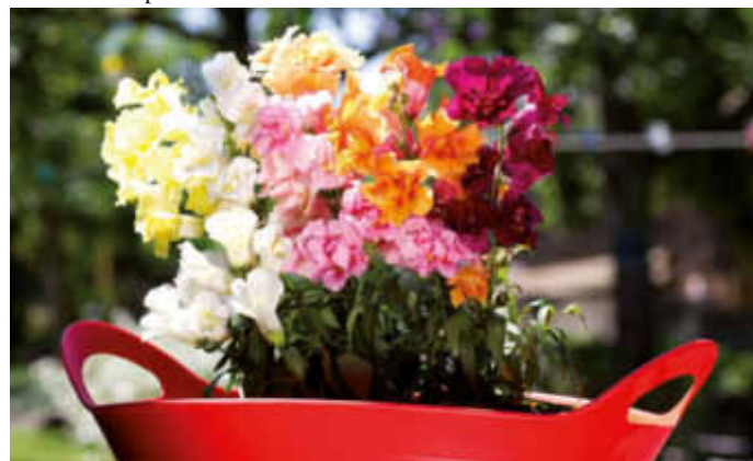
Fröhliche Stimmung verbreiten die kunterbunten Blüten der Löwenmälchen-Mischung "Twinny Mix".

akz-o Kunterbunter Blütenzauber ist mit den neuen gefüllten Löwenmälchen (lateinischer Name "Antirrhinum majus") "Twinny Mix" garantiert. Fast das gesamte Farbspektrum wird abgedeckt durch Töne wie hell- und dunkelrosa, scharlachrot, orange, gelb und reinweiß bis hin zu bronze. Die einjährigen Pflanzen bilden kurze, kräftig-grüne und reichlich verzweigte Stiele, an denen sich die herrlich gefüllten Blüten über viele Monate zahlreich präsentieren - von Juli bis Oktober. So sind die Zierpflanzen äußerst beliebt.