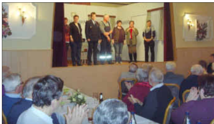
die Delver Speeldeel