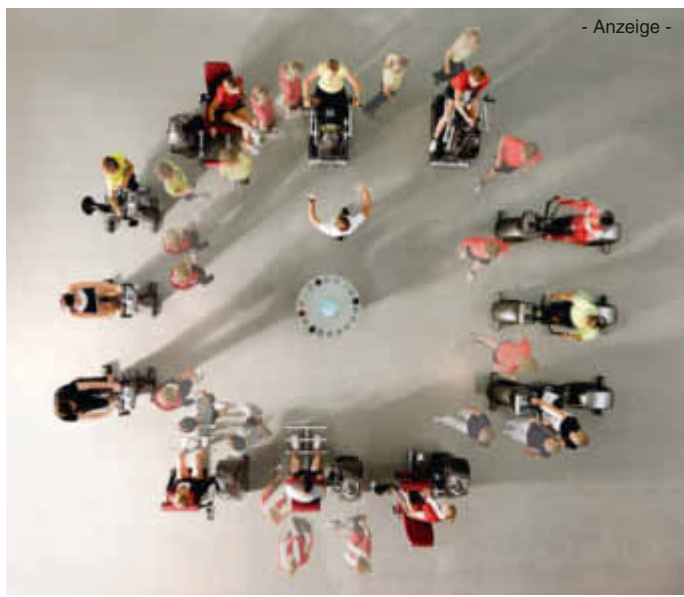
- Anzeige -