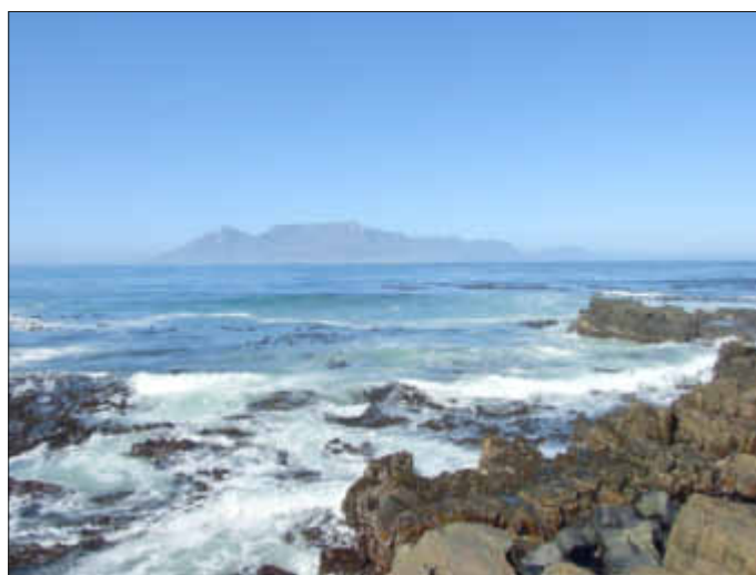
Skyline von Kapstadt mit dem Tafelberg