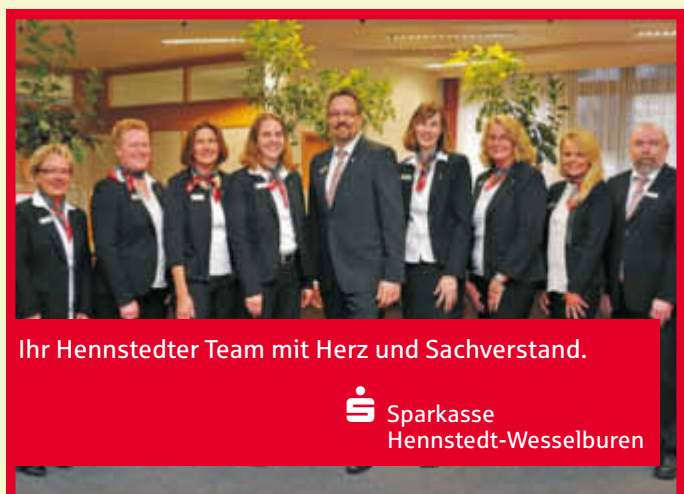
Ihr Hennstedter Team mit Herz und Sachverstand.