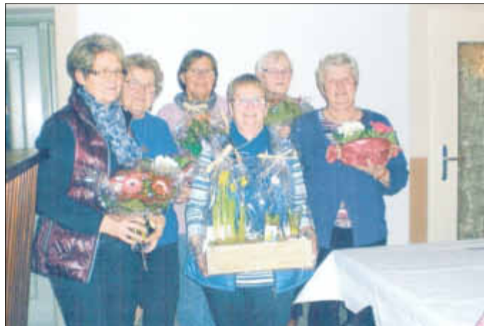
Ehrungen beim Frauenchor Hennstedt