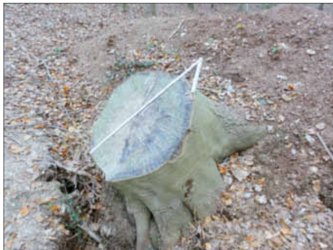
Das ist der Rest, einer 127 Jahre alten Buche. Der Zollstock misst knappe 90 Zentimeter Durchmesser.