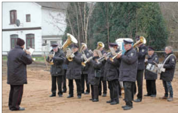
Der Feuerwehrmusikzug Hennstedt sorgt für den musikalischen Rahmen.