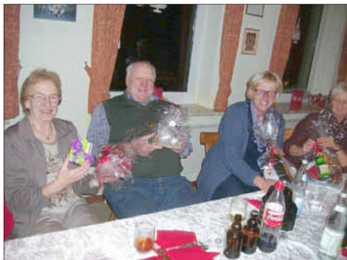
Reichlich Gewinne nach dem BINGO Spiel.