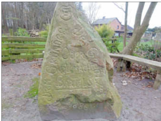
Gründer des Gehölzes, Obervollmacht Bartels.