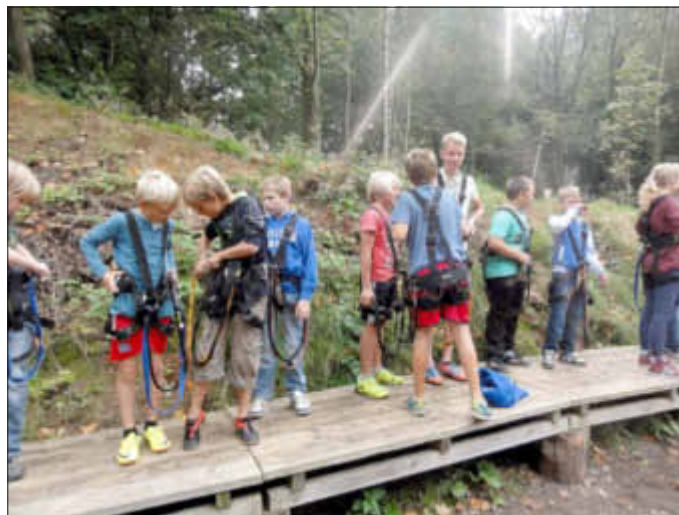
Gurte anlegen für den Kletterpark in Hademarschen

Das über ein Jahr andauernde Projekt „Lunden macht´s möglich“ mit reichlich Programmpunkten für die Jugend geht so langsam zu Ende. Das Projekt wurde vom Bundesministerium für Bildung und Forschung gefördert unter dem Motto „Kultur macht Stark“. Ziel der Sache ist, mithilfe lokaler Bündnisse, Kindern und Jugendlichen einen Zugang zur Musik zu eröffnen und Bildungschance zu ermöglichen. Für Lunden und Umgebung schlossen sich die Dithmarscher Musikschule, die Freiwillige Feuerwehr, der Reit- und Fahrverein und der Verein Lunderer Spielleute zusammen. Es galt ein Programm mit viel Musik und Freizeitaktionen für Jugendliche im Alter von 10 bis 16 Jahren auf die Beine zu stellen. Jeweils die Vorsitzenden mit Helfern nahmen sich dieser Aufgabe an. Keine leichte Aufgabe, denn eine lange Vorarbeit und ganz viel Bürokratenarbeit gingen voraus. Bis schließlich auf einem Flyer 12 ganz tolle Veranstaltungstage, pro Monat eine, zusammen kamen. Die Touren werden gemeinsam mit den Betreuern aus den Vereinen in einem Bus unternommen. So ging es im Januar zur Brunsbütteler Schleuse und im Anschluss in das Elbeforum zu „Pop meets Classic“.