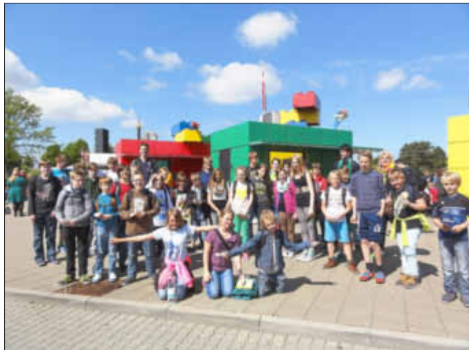
Im Legoland Dänemark