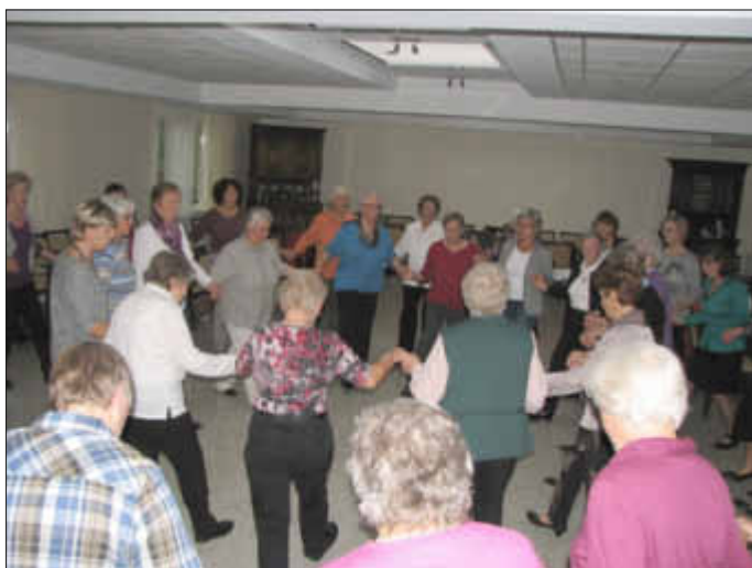
Teilnehmerinnen aus den DRK-Tanzkreisen in Aktion.