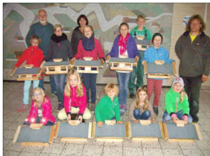
Die kleinen Baumeister mit ihren Futterhäusern.