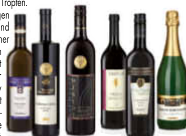
Ein Fest für Genießer: das Württemberger Weinpaket.

Mit einer guten Mischung aus diesen Traditionsrebsorten und seltenen Spezialitäten ist man an Weihnachten auf der sicheren Seite. Die Württemberger Weingärtnergenossenschaften haben deshalb unter www.kenner-trinken-wuerttemberger.de ein passendes Festpaket mit sechs edlen Tropfen zum Schenken und Genießen zusammengestellt: einen prickelnden Grauburgunder Sekt „extra brut“ aus bester Lage, eine trockene Riesling Spätlese, einen leicht restsüßen Zweigelt, würzigen Lemberger, fruchtigen Merlot und tiefrotten Mitos. Für jeden Genießer ein Fest.