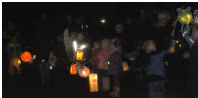
Laternen, Sonne, Mond und Sterne...