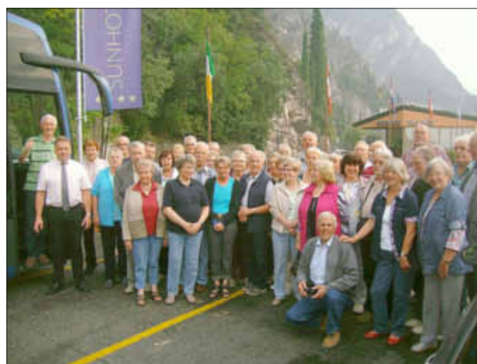
Im Bild die Reisetilnehmer vor der Abfahrt zur Rückreise vor dem Hotel in Limone.