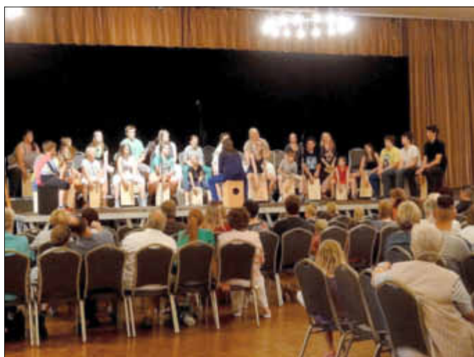
Auftritt beim Musikschulfest in der Dithmarschen Halle in Meldorf. Cajon Trommeln.