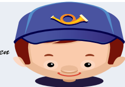
Bei Nachrichten für Ihre Lieben ...