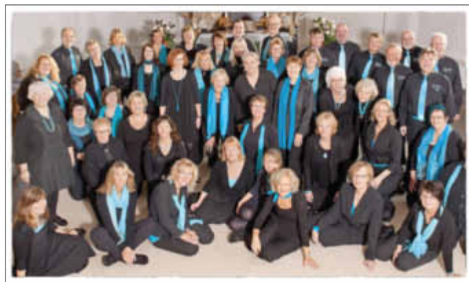
Vorfriede auf das Auftaktkonzert der Aktion Sterntaler am 7. November in Meldorfer - der Heider Gospelchor Crossline.