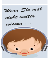
Wenn Sie mal nicht weiter wissen ...