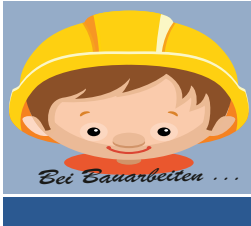
Bei Bauarbeiten ...