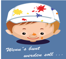
Wenn's bunt werden soll ...