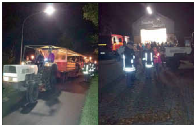
Umzug durchs Dorf und Ankunft beim Feuerwehrgerätehaus

Begleitet vom Musikzug der Freiwilligen Feuerwehr Delve auf dem Planwagen von Henning Peters und von Fackelträgern der Freiwilligen Feuerwehr Hollingstedt starteten die Teilnehmer bei ruhigem Herbstwetter zum Umzug durch unser Dorf. Ziel war das Dorfgemeinschaftshaus am Möhlenweg. Hier hielten Kameraden der Feuerwehr Grillwurst und Getränke für die „Laternenwanderer“ bereit.