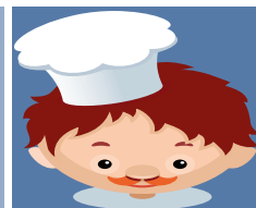
Wenn der kleine Hunger kommt ...