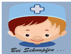
Bei Schnupfen ...