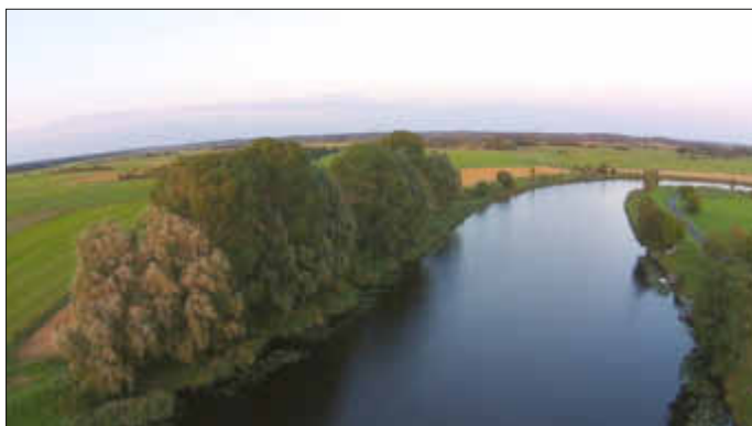
Die Eider von oben: Mit Hilfe einer Kameradrohne gelingen Aufnahmen wie diese.