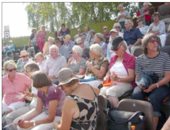
Die Lunderer Landfrauen warten auf den Beginn von ANATEVKA.

Eine Gruppe Lunderer Landfrauen und Gäste machte sich am 27.07.2014 um 11 Uhr mit dem Bus auf den Weg nach Eutin. Im Rahmen der Eutiner Festspiele wurde das Musical ANATEVKA aufgeführt. Bepackt mit allem, was jeder für ein ausgiebiges Picknick brauchte, wie Decke, Sitzkissen, diverse Leckereien, Getränke und Regenzeug machten es sich die Landfrauen auf ihren Plätzen im Freilichttheater gemütlich. Allein das Regenzeug war überflüssig, Sonnenhut, Sonnenbrille viel wichtiger, denn die Hitze war atemberaubend und machte vielen Besuchern zu schaffen.