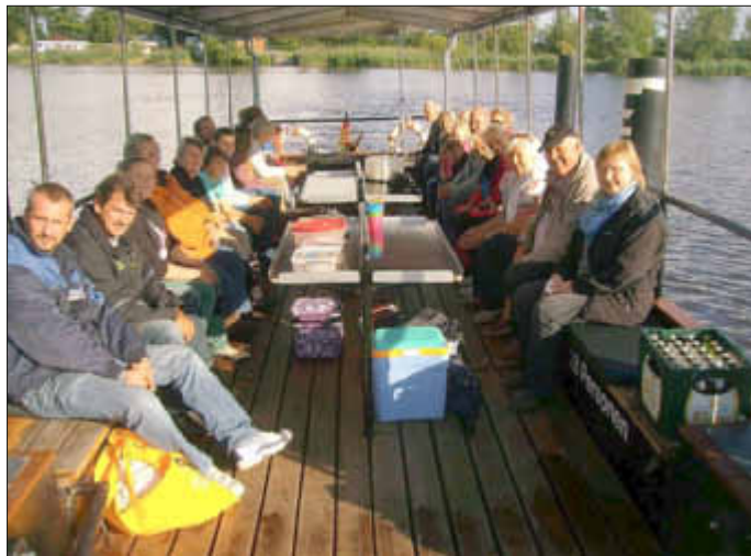
Kurz vor dem Ablegen am Fähranleger Delve - Schwienhusen.

Weitere Bilder auch unter www.hollingstedt-dithmarschen.de