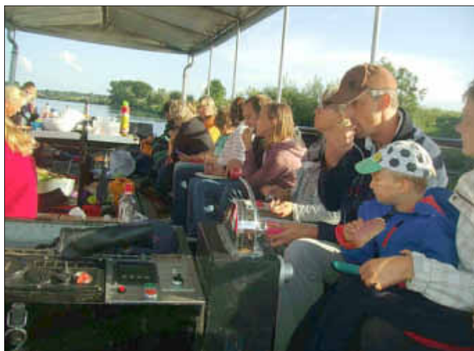
Auf dem Weg nach Pahlen.