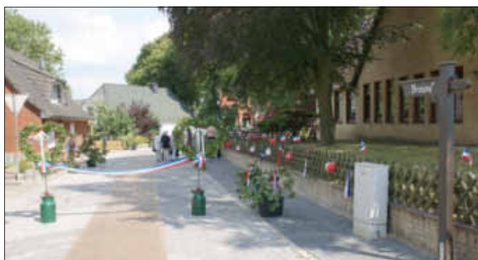
Das frisch vermählte Paar hatte mitten auf dem „Brutgang“ gemeinsame Herausforderungen zu bestehen.

Text und Foto: Eider-Treene-Sorge GmbH, Yannek Drees