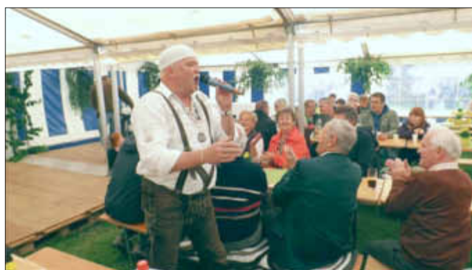
Das DJ Otzi Double in Aktion

Der fünfte Frühschoppen der Jagdhornbläsergruppe Hegering 11 Hollingstedt mit Gästen am Himmelfahrtstag auf der „Pinksoppel“ von Volker Witt in Glüsing wurde wieder von vielen Freunden der Jagdmusik besucht. In diesem Jahr hatten die gastgebenden Bläser die Jagdhornbläsergruppen aus „Süderade - Schelrade“, „Tellingstedt/Meldoir und die „Stapelholmer Jagdbläser“ eingeladen. Mit dem gemeinsamen Signal „Begrüßung“ wurden die zahlreichen Gäste auf den Frühschoppen eingestimmt. Mit weiteren Märschen und Signalen demonstrierten die teilnehmenden Bläsergruppen ihr Können. Im „Rahmenprogramm“ der Veranstaltung erfreuten sich die Gäste über die vielen Präparate heimischer Wildtierarten im neuen Infomobil der Kreisjägerschaft Dithmarschen Nord und die Kinder über