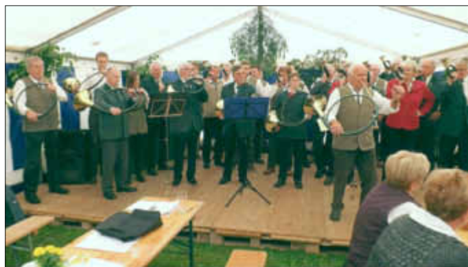
Begrüßung der Gäste

Glüsing/ Bereits zum fünften Mal veranstalteten die Jagdhornbläser vom Hegering 11 Hollingstedt einen Frühschoppen in Glüsing. Zahlreiche Gäste genossen an diesem schönen Frühlingstag die besondere Atmosphäre dieser Veranstaltung und den Auftritt des DJ Ötzi Doubles.