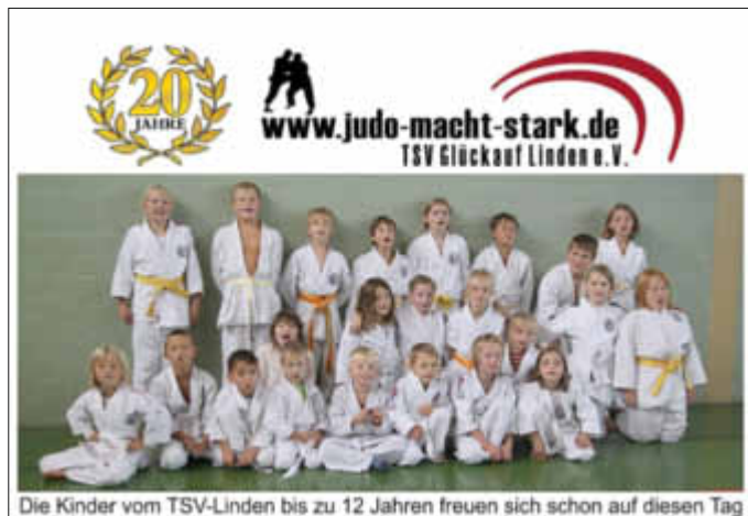
Die Kinder vom TSV-Linden bis zu 12 Jahren freuen sich schon auf diesen Tag

Anlässlich des 20jährigen Bestehens der Judosparte im TSV-Linden veranstalten wir ein Jubiläumsturnier.