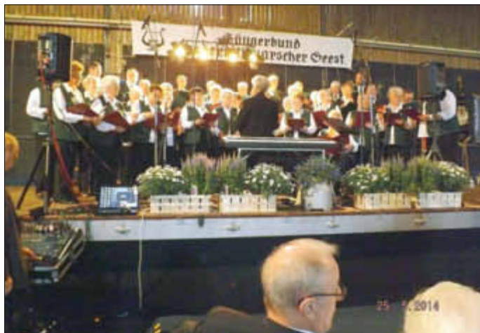
Begrüßungslied der Gemeinsamen Delver Chöre: Freudenklänge, Festgesänge

Frauenchor Delve feiert Jubiläum und Bundessängerfest Delve/Pahlen, Mit 60 Jahren gehört der Frauenchor Delve zu den jüngeren Gesangsvereinen in Dithmarschen. Trotzdem ist dies ein besonderer Grund zum feiern und das 106. Bundessängerfest der Norderdithmarscher Geest auszurichten. In den Grußworten der Honoratioren wurde herausgestellt, dass das gemeinschaftliche Singen viel Freude bereitet, eine Stärkung und kulturelle Bereicherung des Gemeinwesens darstellt, länger gesund hält und Aggressionen abbaut. Ein Festredner ließ es sich nicht nehmen, deshalb alle Politiker zum Singen zu verpflichten.