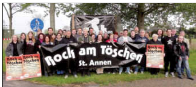
Vorbereitungstreffen mit vielen freiwilligen Helfern, Vertreter der Bands und die Organisatoren des Vereins Dorf und Welt.

St. Annen (rsI) Der Countdown läuft und es gibt noch viel vorzubereiten. „Rock am Töschen 2014“ am Sonnabend, dem 24.05 ab 17 Uhr in St. Annen hinter der Kirche der Heiligen Anna. Auch in diesem Jahr ist die Veranstaltung „Rock am Töschen“ wieder eine Benefizveranstaltung. Gagen, Erlöse und Spenden kommen dem „Bunten Kreis Nord“ zu Gute. Der Bunte Kreis Nord ist zuständig für die sozialmedizinische Nachsorge von schwerkranken Kindern mit Sitz im WKK Heide. Die Atmosphäre und der gute Zweck veranlassen immer mehr Leute das beliebte Festival direkt an der Bundesstraße (L156) mit der ganzen Familie zu besuchen. St. Annen ist im Ausnahmezustand, ganz viel Zusammenhalt im Dorf und viele Freunde begleiten stärken das Festivalgeschehen.