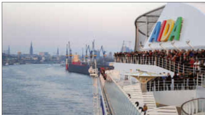
Auslaufen in Hamburg

Am 29. März um 12:30 checkte eine Gruppe Lundener Landfrauen, Ehemänner und Gäste auf der AIDA SOL ein. Nach überstandener Schiffsbesichtigung und obligatorischer Sicherheitsübung in voller Schwimmwesten-Montur hieß es um 18:00 Uhr: Leinen los!