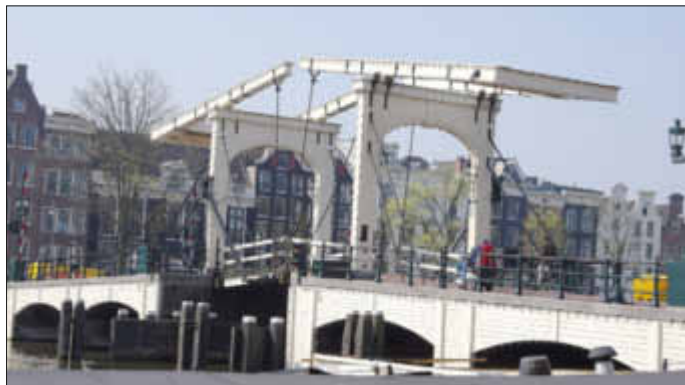
Die 1670 erbaute Zugbrücke Magere Brug wird alle 20 Minuten für den Schiffsverkehr auf den Grachten geöffnet.

Der vierte und letzte Anlegehafen war Amsterdam. Da das Kreuzfahrtterminal nur 10 Gehminuten von der Innenstadt entfernt ist, nutzten die meisten Landfrauen den warmen Sommertag zu einem Ausflug auf eigene Faust. Sie schauten sich das Anne Frank Huis, das Käse-Museum oder die Magere Brug, die berühmteste der rund 1300 Amsterdamer Brücken an. In der Innenstadt herrschte ein Gewusel von Fahrrädern, Autos, Bussen, Straßenbahnen und Menschen. Zur Erholung durfte deshalb eine Fahrt durch die im Halbkreis um das Stadtzentrum angelegten Grachtenringe auf keinen Fall fehlen.