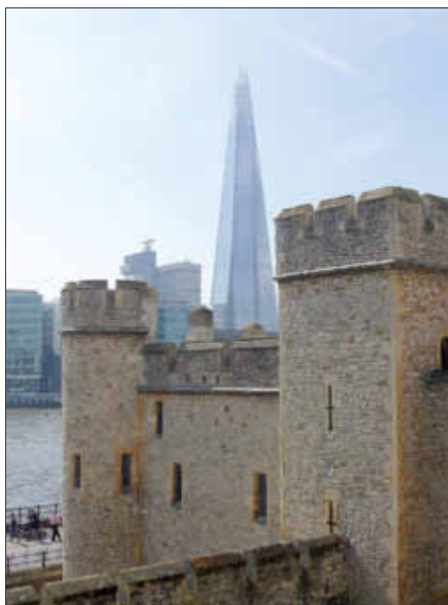
Gegensätze: Blick vom mittelalterlichen Tower zum höchsten Wolkenkratzer Europas, dem 310m hohen Shard-Tower.

Der nächste Anlaufpunkt war Southampton. Hier hatte der Großteil der Gruppe einen Landausflug nach London mit Schwerpunkt Tower gebucht. Dort konnte man sich auf eigene Faust die Kronjuwelen und andere Museen auf dem Gelände anschauen. Anschließend gab es eine geführte Stadtbesichtigung per Bus und zu Fuß durch den sonnendurchfluteten Kensington-Park zum Buckingham-Palast.