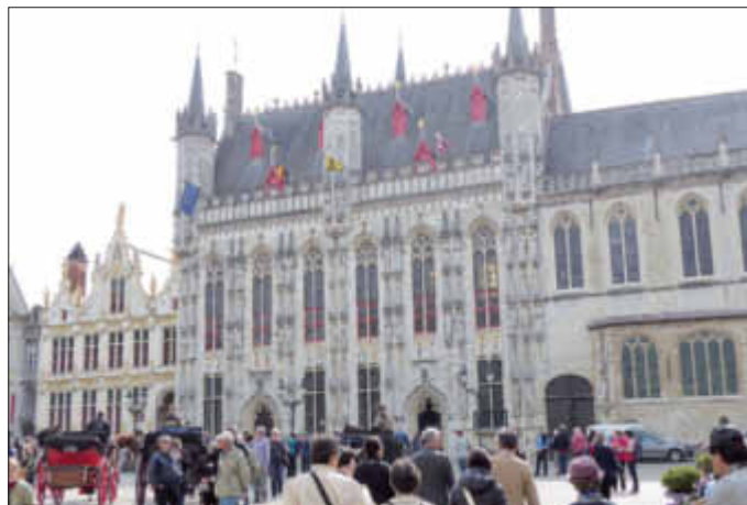
Das „Paleis van het Brugse Vrije“ links neben dem Rathaus von Brügge

Das dritte Ziel hieß Zeebrugge, der zweitgrößte Hafen nach Antwerpen in Belgien. Eine halbe Stunde Busfahrt entfernt liegt Brügge, die Hauptstadt der Provinz Westflandern. Während Zeebrugge im Zweiten Weltkrieg schwer zerstört wurde, blieben die mittelalterlichen Gilde- und Hansehäuser, Prachttürme und Kirchen in Brügge erhalten. Diese konnte man besonders gut bei einer Bootsfahrt auf den malerischen Grachten des „Venedig des Nordens“ betrachten.