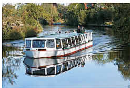
Schiff 'Onkel Heinz'