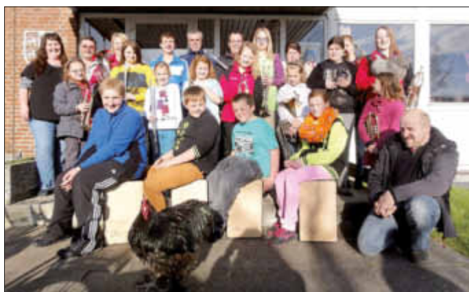
Zwei Vereine wollen sich zeigen.