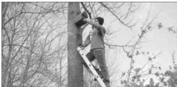
Ein Fledermauskasten wird gesäubert.