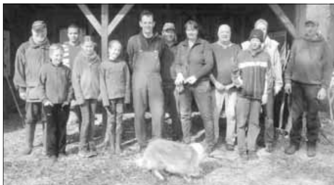
Die fleißigen Helfer