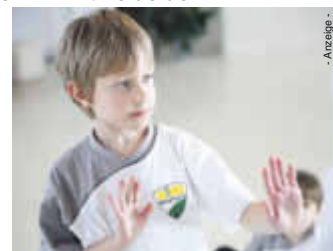
Malte bewacht seine Grenzen