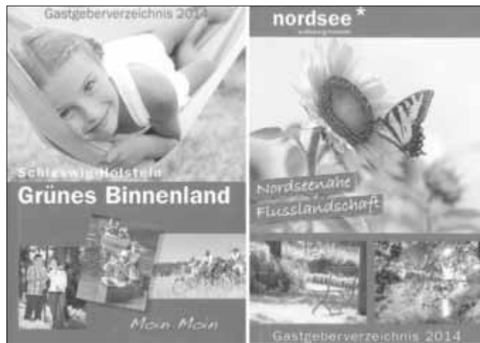
Das neue gemeinsame Gastgeberverzeichnis der Gebietsgemeinschaft Grünes Binnenland e. V. und dem Wirtschafts- und Tourismusverein Viöler Land e. V.

Text und Grafik: Eider-Treene-Sorge GmbH, Pia Weischer