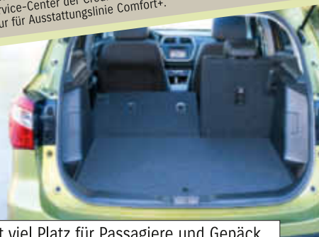
Der neue SX4 S-Cross bietet viel Platz für Passagiere und Gepäck

Neues Design: Eine dynamische Linienführung unterstreicht das prägnante Crossover-Styling des neuen SX4 S-Cross. Im Innenraum setzt sich diese Optik konsequent fort. Funktionalität ist hier gepaart mit hochwertigen Materialien. Ein Highlight ist das einen Meter lange Panorama-Schiebedach.