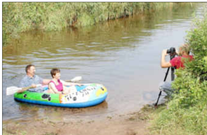
Text und Foto: Eider-Treene-Sorge GmbH, Pia Weischer

Mit den ersten Ergebnissen kann bis zum Ende des Jahres gerechnet werden, so dass die Videos auch schon auf den Tourismusmessen gezeigt werden können und die Gäste ihre Gastgeber kennenlernen können.