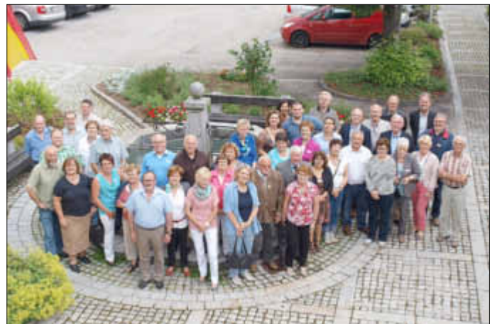
Die Teilnehmer vor dem Gemeindeamt