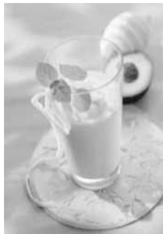
Leckerer Fitmacher: Avocado-Buttermilch-Smoothie.

Dachten Sie auch, Hass Avocados wären Gemüse? Kein Wunder, denn traditionell werden sie für würzige Guacamole verwendet. Die Frucht mit dem nussigen Geschmack kann aber auch anders!