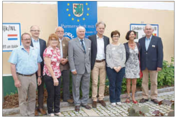
Bürgermeister und die nationalen Komitee-Vorsitzenden, in ihrer Mitte der alte und der neue internationalen Präsident