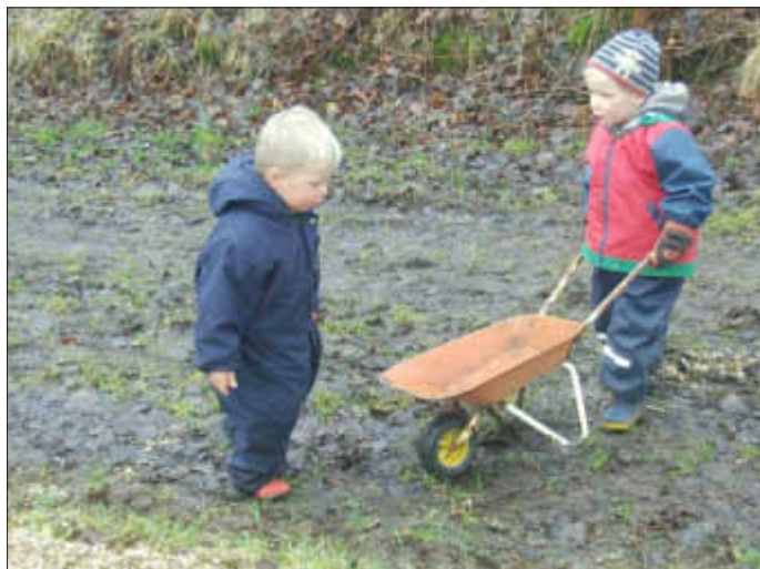
Nachwuchskräfte bei der Arbeit.

Infos auch unter www.schulwald-delve.de