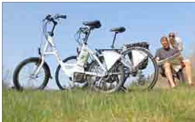
Mit Rückenwind durch die Flusslandschaft - auch in der Saison 2013 sind E-Bikes in der Region verfügbar.

Text: Eider-Treene-Sorge GmbH, Pia Weischer