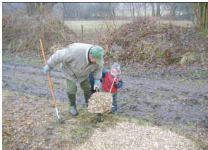
Mit vereinten Kräften wird Schreddergut auf die Wege gefahren.

Mitglieder der Arbeitsgruppe Natur, Kinder aus Hollingstedt und Delve mit ihren Eltern, Großeltern und Jäger des Hegering 11 richteten den Schulwald für den Start in die Saison 2013 her. So wurden Bauminformationsschilder, Hinweisschilder für das Feuchtbiotop und Knick, der Wildwürfelständer, der Bienschaukasten und eine Infotafel wieder angebracht und die Wege mit Schreddergut aufgefüllt. Als Ersatz für die vor zwei Jahren abgesägten Bäume wurden jetzt sechs neue gepflanzt. Über die neuen Bäume freuen sich die Schulwaldfreunde.