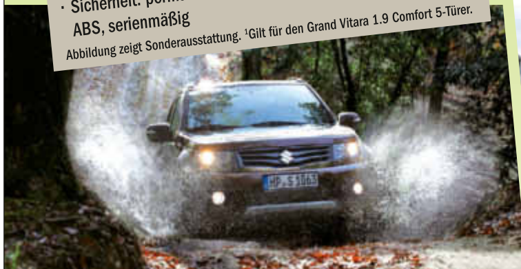
Abbildung zeigt Sonderausstattung. 1 Gilt für den Grand Vitara 1.9 Comfort 5-Türer.