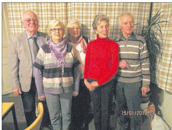
Der bestätigte Vorstand des gemischten Chores Wrohm