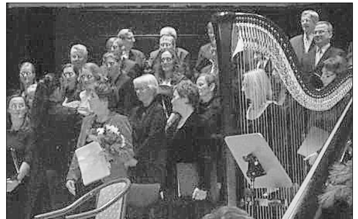
Margot Käßmann (mit roter Jacke)