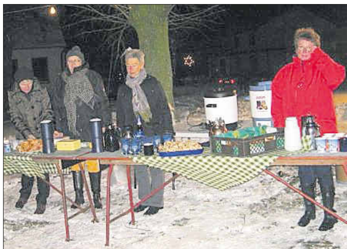
Bei Eis und Schnee verkauften die Landfrauen in der Pause heiße Getränke und kleine Köstlichkeiten