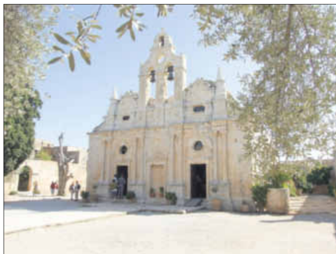
Kirche des Klosters Arkadi,