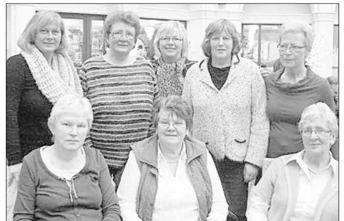
Fröhliche Runde auf dem Bremer Weihnachtsmarkt