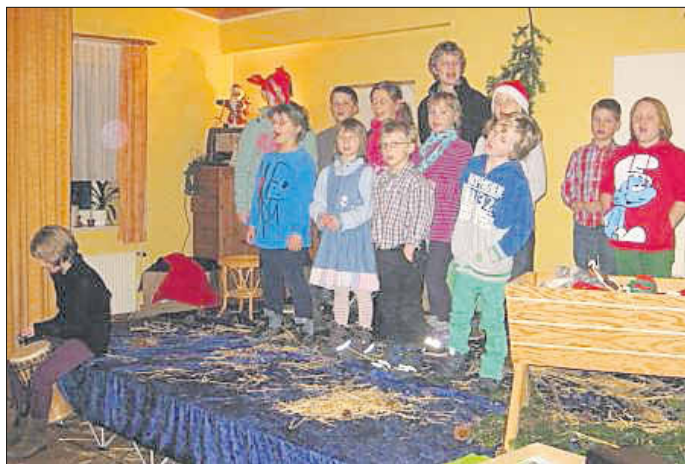
Kinder aus Kleve erfreuen uns mit Gedichten und Liedern