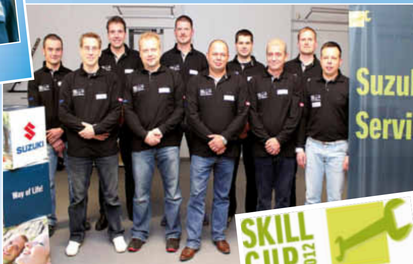
Die 10 Finalisten am 20. November 2012 in der Firmenzentrale in Bensheim

„Durch konsequente Aus- und Weiterbildung unserer Mitarbeiter erreichen wir ein sehr hohes Service Niveau, von dem unsere Kunden profitieren. Alle unsere Mitarbeiter nehmen regelmäßig an entsprechenden Schulungen teil, um bei der Fehlersuche und Wartung möglichst effizient