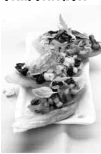
Schmecken sogar auf Brot: Crostini mit dreierlei Belag aus Trockenpflaumen, Tomate und Salami. Foto Crostini-Trio

Wer täglich Trockenfrüchte isst, schafft es leichter, die empfohlene Menge an fünf Portionen Obst und Gemüse pro Tag zu erreichen. Die optimale Snackgröße ist eine kleine Portion von drei Stück. In der Regel sind das 24 g Trockenpflaumen, die 58 kcal enthalten.