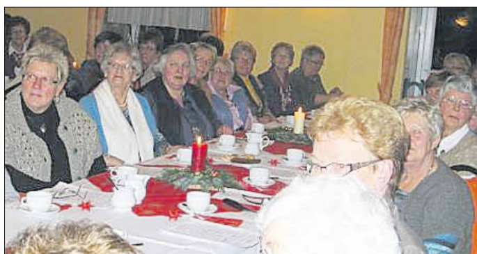
Mitglieder lauschen den Vorträgen