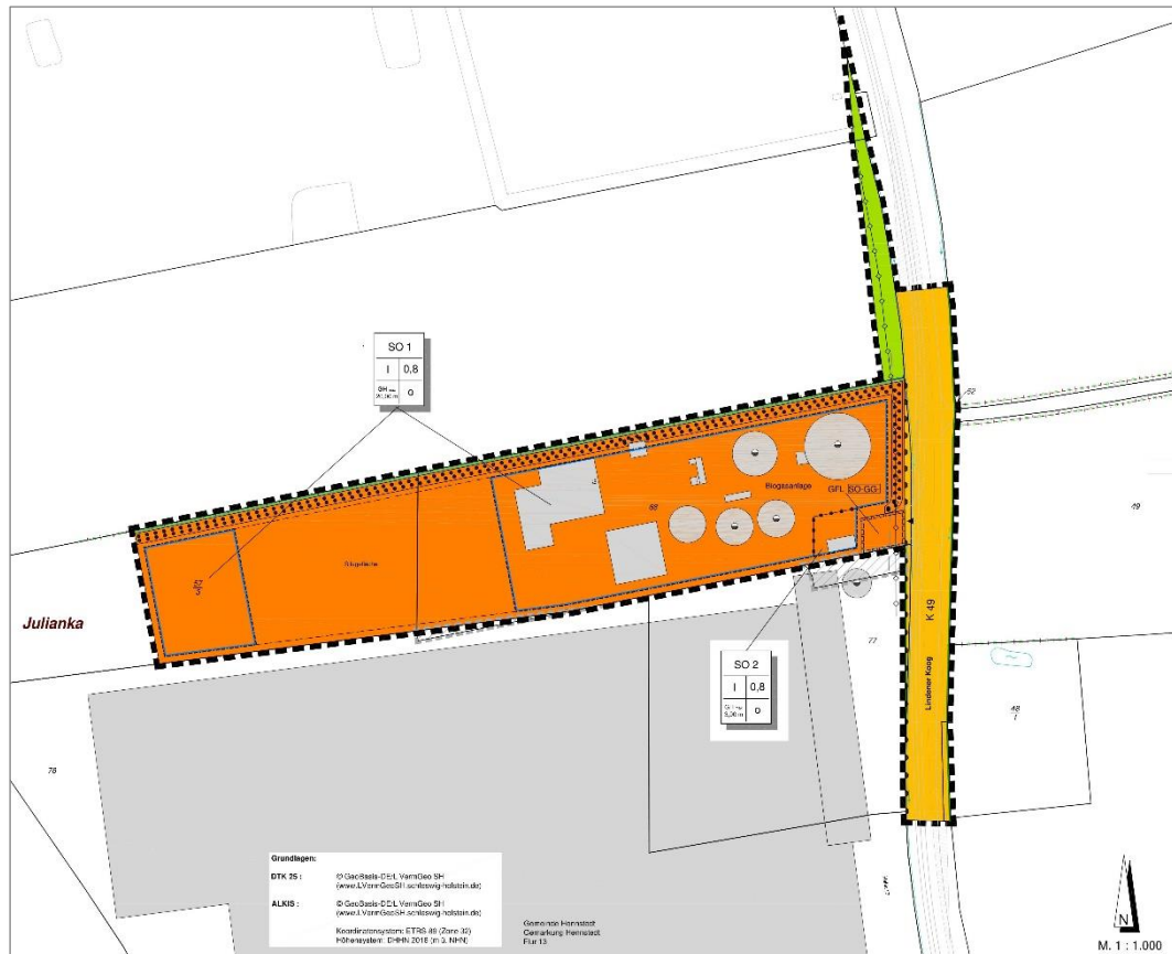
Abb. 2: Vorentwurf des B-Plans Nr. 13, 2. Änderung und Erweiterung (IPP 06/2023)

Innerhalb des vorliegenden B-Plans sind folgende Festsetzungen vorgesehen: