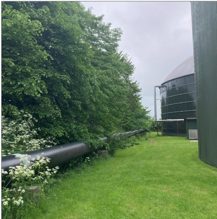
Foto 3: Links Knick an der Grenze des Plangebiets, rechts Biogasanlagen, Blickrichtung Norden (eigene Aufnahme vom 24.05.2023)