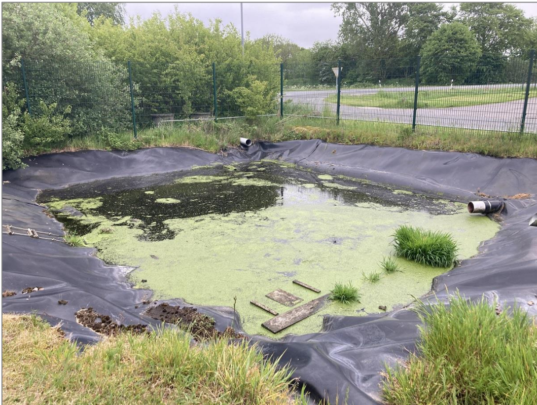
Foto 5: Sonstiges künstliches Foliengewässer (Regenrückhaltebecken), Blickrichtung Südost (eigene Aufnahme vom 24.05.2023)