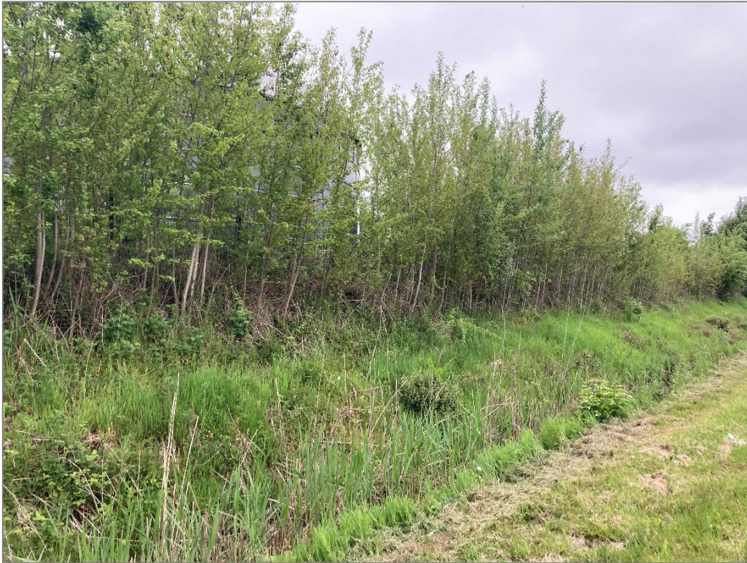
Foto 6: Graben und Knick mit Zitterpappeln, im Hintergrund Biogasanlage, Blickrichtung Nordwesten (eigene Aufnahme vom 24.05.2023)