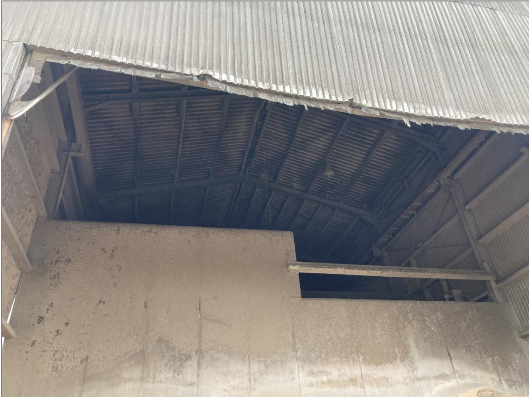
Foto 2: Blick in eine der Hallen, Blickrichtung Norden (eigene Aufnahme vom 24.05.2023)