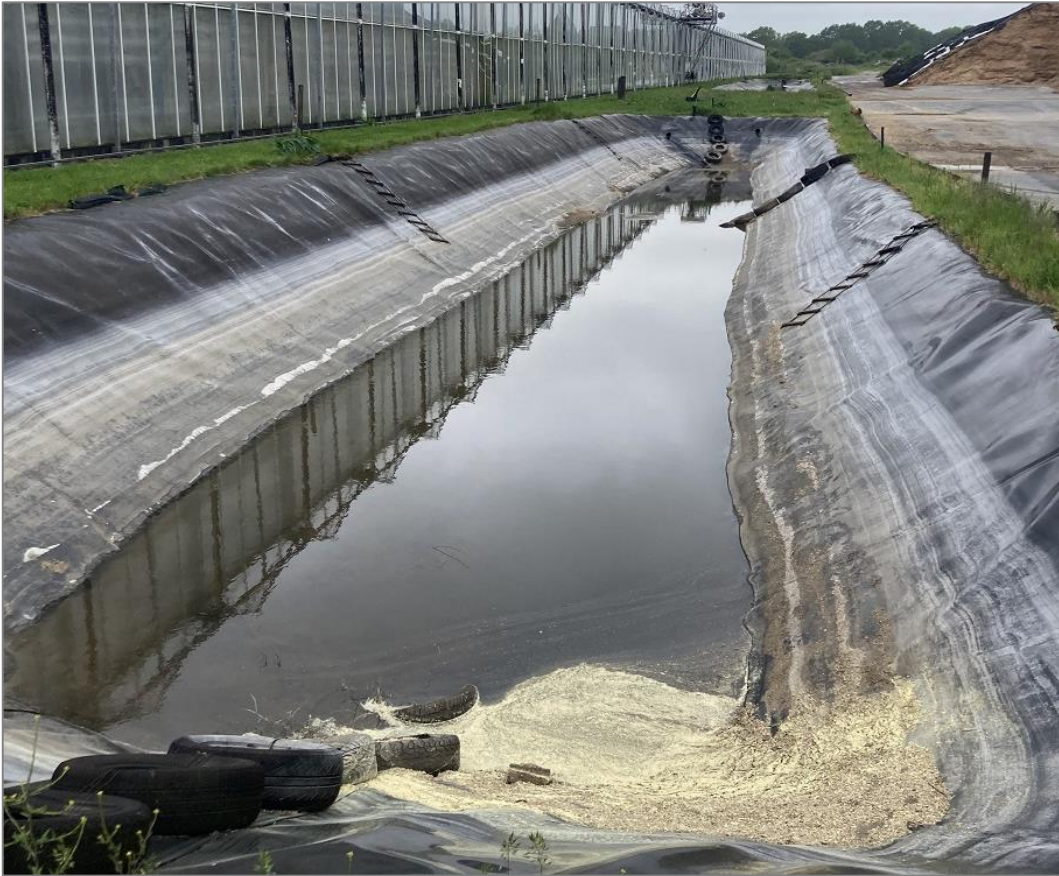
Foto 4: Sonstiges künstliches Foliengewässer, Blickrichtung Westen (eigene Aufnahme vom 24.05.2023)