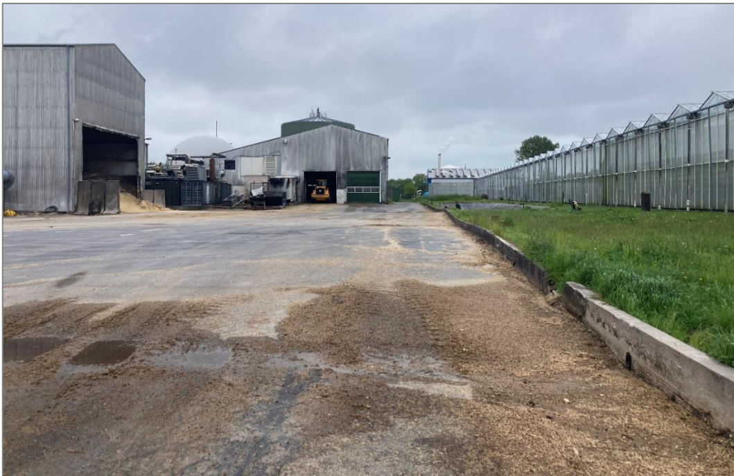
Foto 1: Biogasanlage im Plangebiet und rechts die an das Plangebiet angrenzende Gewächshausanlage, Blickrichtung Osten (eigene Aufnahme vom 24.05.2023)

Im westlichen Teil des Plangebiets befindet sich eine Grabenstruktur, die mit Erlen ( Alnus ) und Schilf bewachsen ist sowie ein mit Binsen und Schilf umstandener wasserführender Tümpel. Weitere Gräben befinden sich entlang der Straße „Lindener Koog“. Die Gräben und der Tümpel stellen potenziell attraktive Habitate für Amphibien dar. Die technischen Foliengewässer sind z.T. extrem eutrophiert und ohne Vegetation (vgl. Foto 4) und haben daher keine Relevanz für Amphibien. Das Regenrückhaltebecken ist ebenfalls als ein künstlicher Folienteich angelegt und hat eher eine geringe Habitatqualität für Amphibien (vgl. Foto 5).