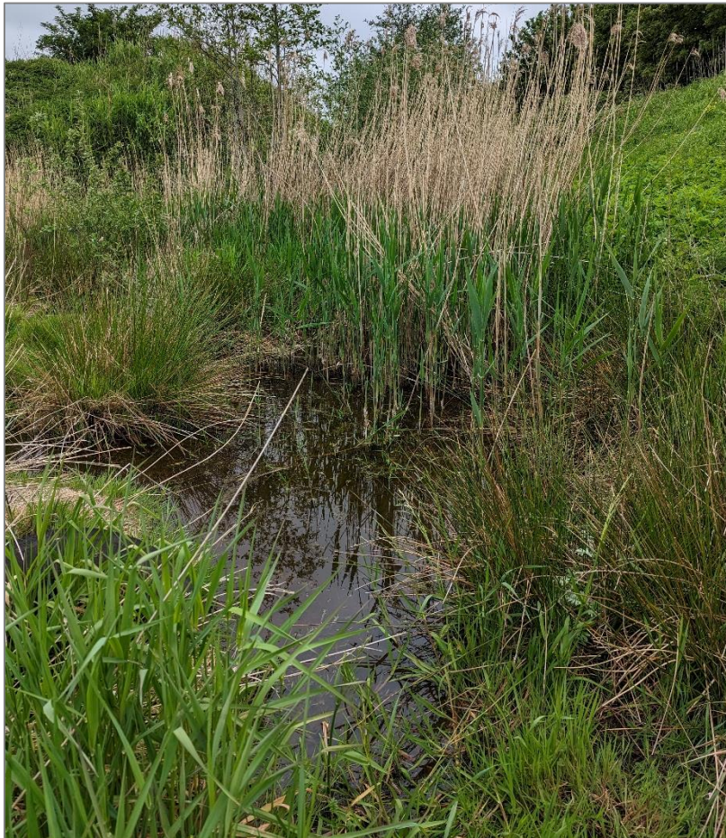
Foto 7: Mit Schilf und Binsen umwachsender Tümpel im Nordwesten des Plangebiets, Blickrichtung Westen (eigene Aufnahme vom 24.05.2023)