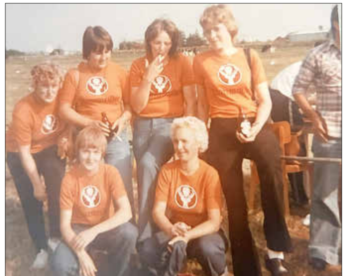
Das 1. Mannschaftsfoto 1977

Vor 50 Jahren haben die Frauen und Mädchen aus Krempel eine Boßelgruppe gegründet. Mit ein paar anderen Vereinen des Hauptverbandes waren die Kremplerinnen hier „Vorreiter“. Auf dem Werner-Köster-Platz in Krempel findet am 19.09.2026 die Jubiläumsveranstaltung statt. Einladungen folgen an die Fruunsboßelvereine. Den Termin bitte schon mal vormerken.