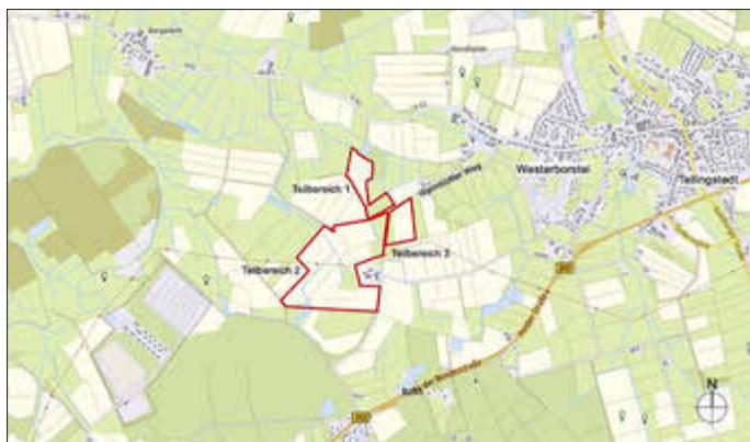
Übersicht räumlicher Geltungsbereich