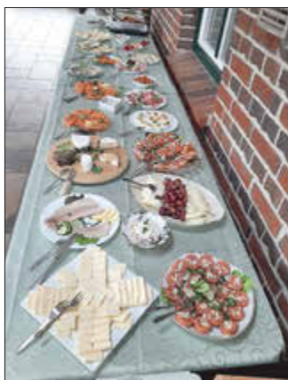
Ein Teil des leckeren Frühstücksbuffets